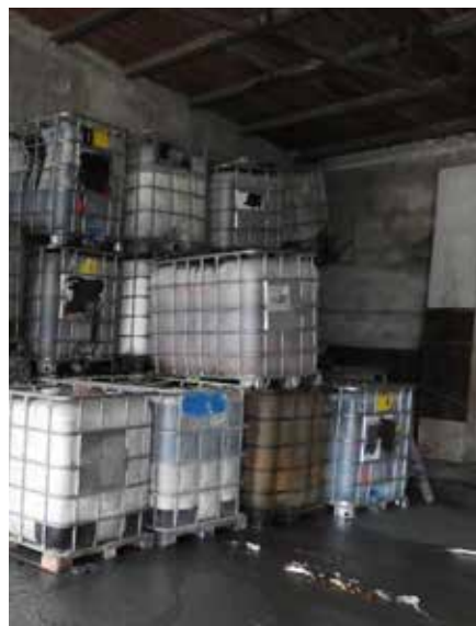
Miasto otrzymało dofinansowanie na usunięcie niebezpiecznych odpadów

W związku z tym, że problem pojawił się w momencie zmiany właściciela terenu, na którym zgromadzone były niebezpieczne odpady, sytuacja dodatkowo się skomplikowała. Od marca 2018 roku miasto prowadziło postępowanie wyjaśniające, które miało na celu ustalić faktycznego posiadacza odpadów niebezpiecznych, w tym ich wytwórcę oraz sprawcę, który porzucił odpady. W grudniu 2018 roku – wobec niewykania sprawy przestępstwa – Prokuratora Rejonowa w Mikołowie umorzyła sprawę.