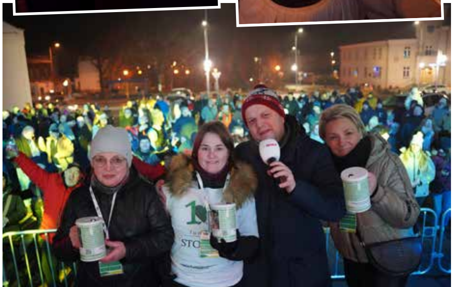
Fot. J. Mecner