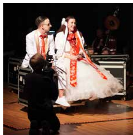
Spektakl miał charakter eksperymentu telewizyjnego