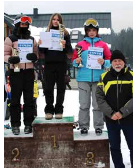
Zawody rozgrywano w kilku kategoriach wiekowych

Pierwsza edycja Międzygminnych Zawodów w Narciarstwie Alpejskim z pewnością zapisze się w pamięci uczestników. Już dziś zapowiadany jest rewanż w kolejnej edycji, co rokuje, że impreza na stałe wpisze się w kalendarz sportowych wydarzeń regionu. ❖kpj