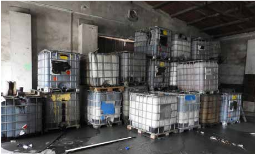
W 2018 roku odkryto 25 tysięcylitrowych pojemników z substancjami nieznanego pochodzenia