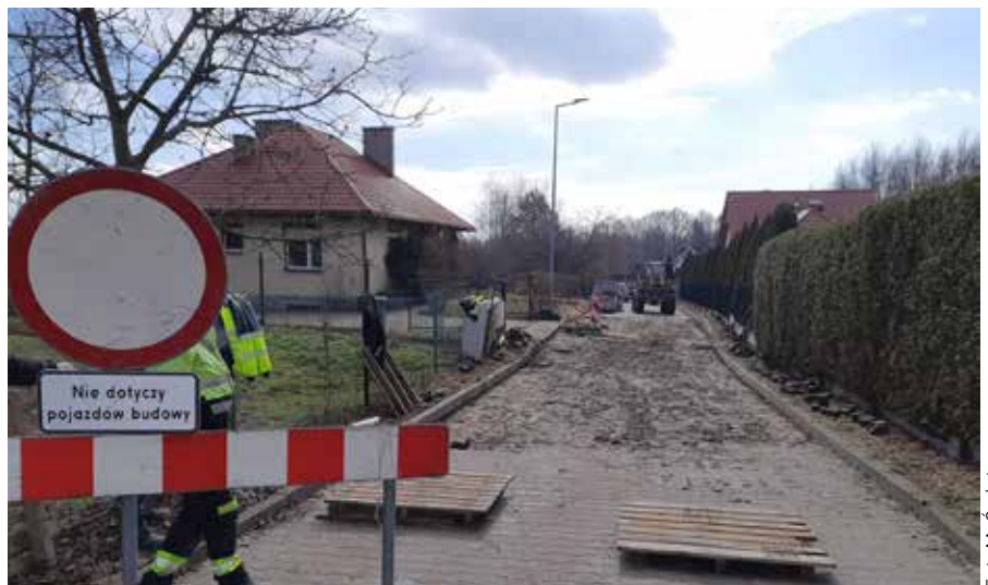
Trwają prace remontowe na ul. Rolnej w Łaziskach Górnych

Najpierw zapadła się droga. Uszkodzenie ul. Rolnej było na tyle poważne, że zablokowany został przejazd w tym miejscu. Przyczyną okazały się szkody górnicze. Po tymczasowym uporządkowaniu odcinka ulicy przywrócono tam przejazd, jednak remont okazał się konieczny. Prace rozpoczęły się 6 lutego. Na czas około dwóch tygodni została zamknięta połowa ulicy.