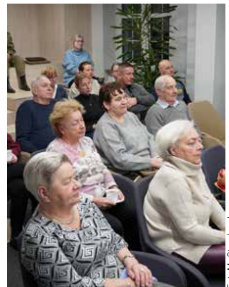
Wydarzenie służyło wspólnemu budowaniu pamięci historycznej