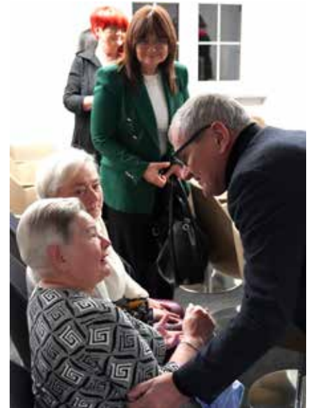
W spotkaniu wzięli udział członkowie rodzin ofiar tragedii

Spotkanie było nie tylko lekcją historii, ale także ważnym momentem pamięci i refleksji – dla jednych bolesnym powrotem do osobistych wspomnień, dla innych odkrywaniem nieznanych dotąd kart dziejów naszego regionu. ❖ms