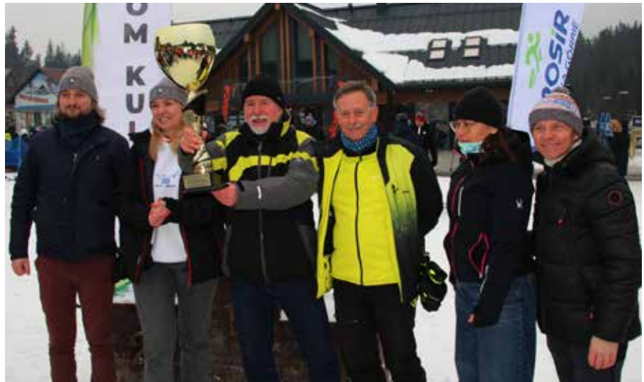
Przechodni Puchar Najszybszej Gminy trafił w tym roku do Miasta Łaziska Górne