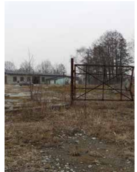
Odpady znajdują się na posesji przy ul. Łazy 21

W listopadzie 2025 roku Miasto Łaziska Górne złożyło wniosek o dofinansowanie z rezerwy celowej budżetu państwa na 2026 rok. Zgłoszenie zostało