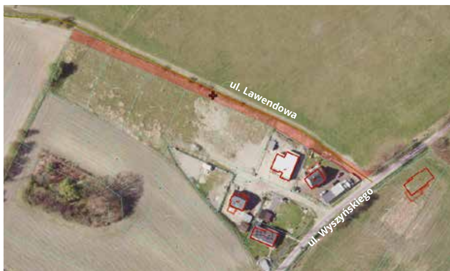
Ulica Lawendowa znajduje się w Łaziskach Średnich

Sąd Rejonowy w Mikołowie uznał właściciela firmy pogrzebowej za winnego