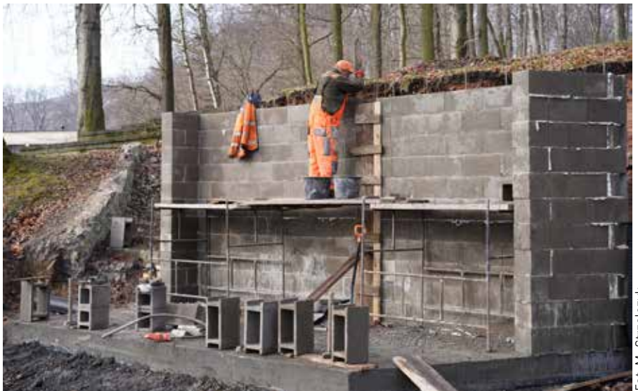
Powstaje nowe zaplecze dla dźwiękowców. Stary obiekt – ze względu na zły stan – musiał zostać wyburzony

leta dla osób niepełnosprawnych. Ściany samej sceny zostały wydłużone, a w następnym etapie będzie dobudowywane zadanie obiektu. Wykonana została podbudowa drogi dojazdowej do sceny i zaplecza. W jej pobliżu powstaną dwa miejsca parkingowe dla niepełnosprawnych, wybudowana zostanie również toaleta. Zdemontowane zostały plastikowe siedziska na widowni, a w ich miejsce – po wyremontowaniu betonowej podbudowy – pojawią się elementy drewniane. Zaplanowane są również m.in. tarasy drewniane oraz duży taras nad widownią. ❖ms