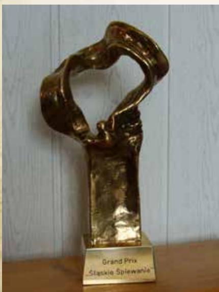
Szczyglik był symbolem i nagrodą dla laureatów Przeglądu Piosenki Dziecięcej Śląskie Śpiewanie

Przegląd Śląskie Śpiewanie rozrastał się z każdym rokiem, a zwiększająca się liczba wykonawców spowodowała, że impreza ta w 1998 roku stała się największym konkursem muzycznym w Polsce. W kolejnych latach finały i koncerty galowe Śląskiego Śpiewania odbywały się np. w Teatrze Śląskim w Katowicach, w Łędzinach, w katowickim Spodku, w Radzionkowie, kilkakrotnie w Piekarach Śląskich, Domu Muzyki i Tańca w Zabrze oraz Chorzowskim Centrum Kultury. Podczas niektórych wydań Śląskie Śpiewanie wzbogacały również imprezy towarzyszące, jak np. konkurs plastyczny pt. Śląsk muzyką malowany. W maju 2003 roku gala finałowa X już edycji Śląskiego Śpiewania ponownie gościła w gmachu łaziskiego MDK. W całym przeglądzie łącznie z przesłuchaniami eliminacyjnymi wzięło udział około sześć tysięcy uczniów. Wówczas wśród jurorów