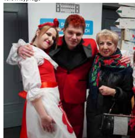
Aktorzy po spektaklu spotkali się z widzami w holu łaziskiego MDK