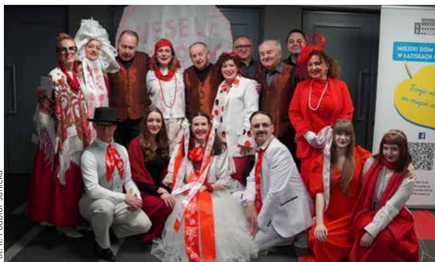
Kostiumy aktorów nawiązywały do Wesela Stanisława Wyspiańskiego