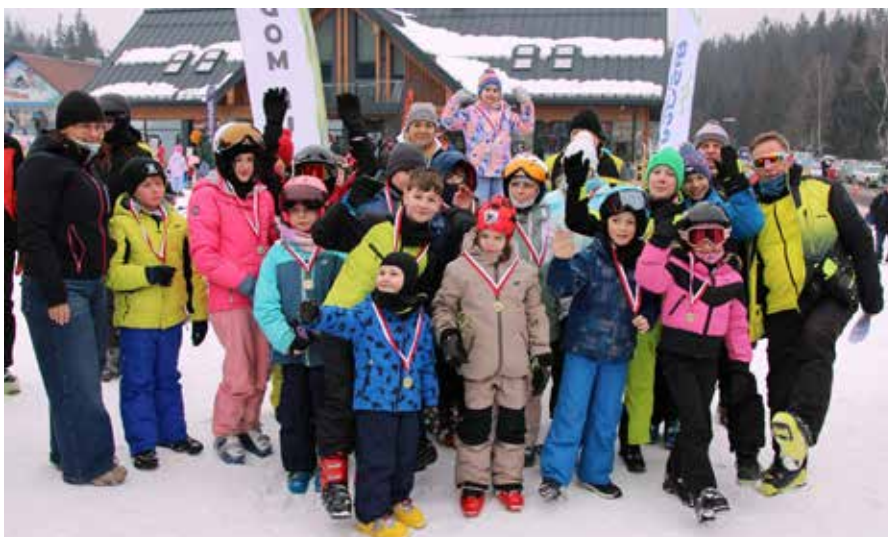
Spotkanie na stoku to nie tylko rywalizacja, ale także świetna zabawa dla całych rodzin