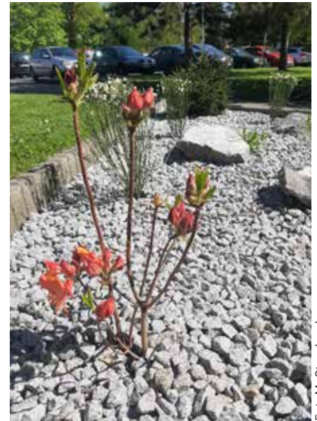
Zieleniec przy parkingu za MDK

W tym roku PGKiM planuje wszystkie rabaty zapełnić nasadzeniami z roślinami wielosezonowymi zimozielonymi oraz mrozoodpornymi. Rabaty miejskie zdobią już przepiękne kompozycje, pojawiło się 200 sadzonek funkii, 100 płomyków i berberysów, kilkadziesiąt hortensji, róż białych. ❖jb