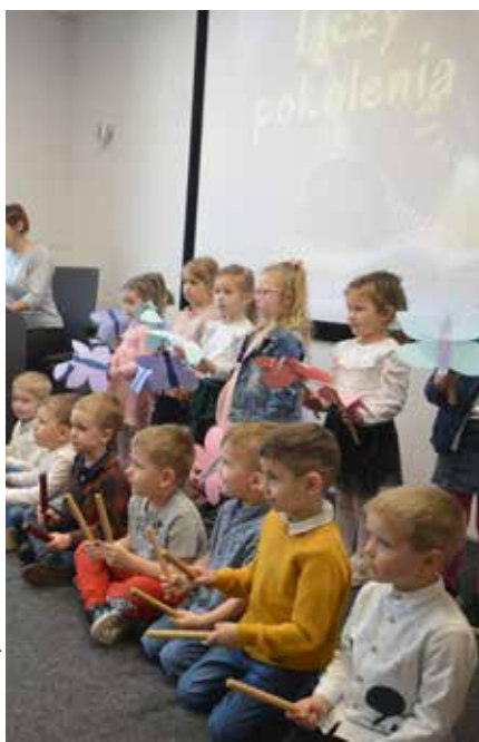
Europejski Dzień Solidarności Międzypokoleniowej w łaziskiej bibliotece