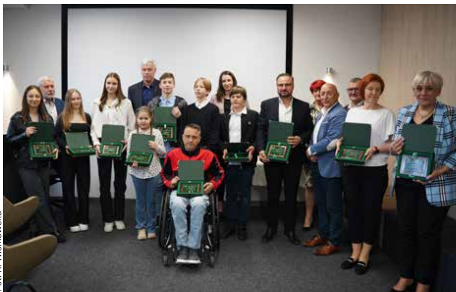
Nagrody łaziskim sportowcom wręczono 24 kwietnia

Szkolenie odbędzie się w ramach Projektu Rozwój usług społecznych dla mieszkańców Miasta Łaziska Górne świadczonych w ramach łaziskiego CUS-u.