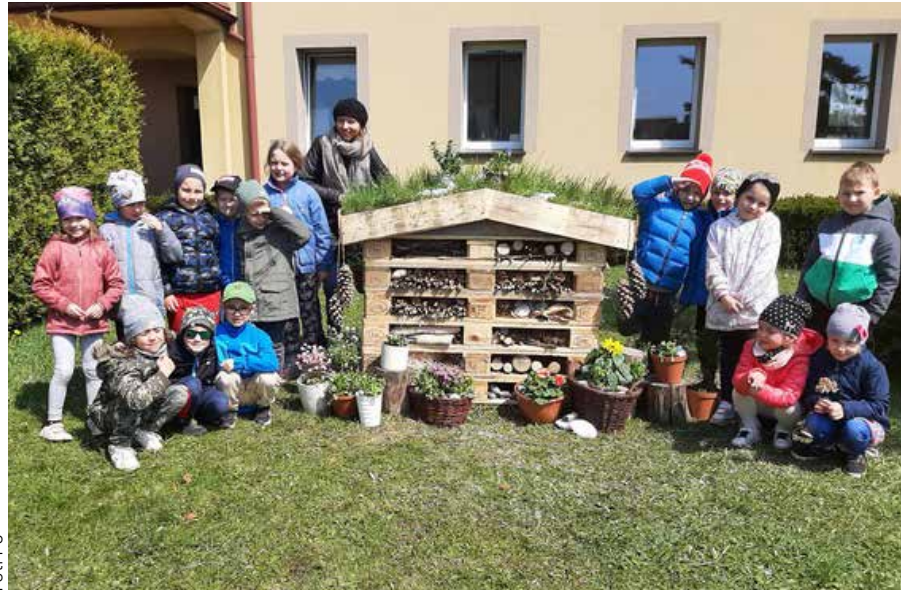
P6 Dzieci z Przedszkola nr 6 zbudowały hotel dla owadów