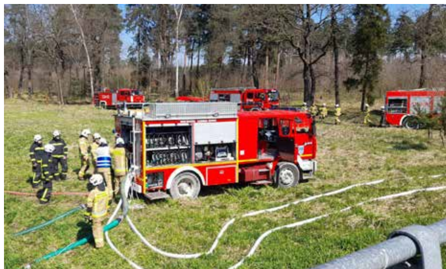
Jednym z elementów ćwiczeń była budowa magistrali wodnej

Z kolei 22 kwietnia – na terenie Nadleśnictwa Kobiór – odbyły się ćwiczenia powiatowe, w których brały udział wszystkie jednostki OSP naszego powiatu mikołowskiego. Głównym założeniem ćwiczeń było ugaszenie symulowanego pożaru kompleksu leśnego, zorganizowanie zaopatrzenia w wodę, budowa magistrali wodnej. Dodatkowo podczas ćwiczeń utworzono sztab akcji oraz zbudowano obozowisko wraz z zapleczem logistycznym na potrzeby prowadzonych działań. ❖red.