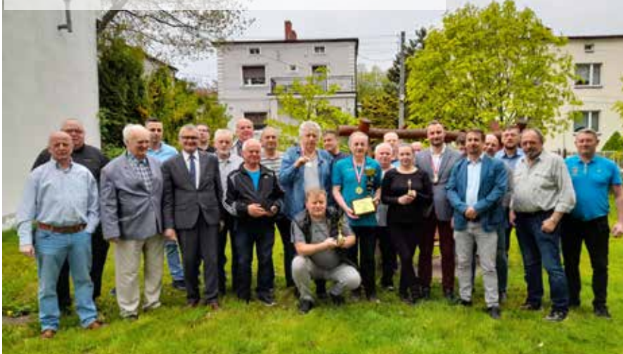
Zakończenie cyklu rozgrywek skata