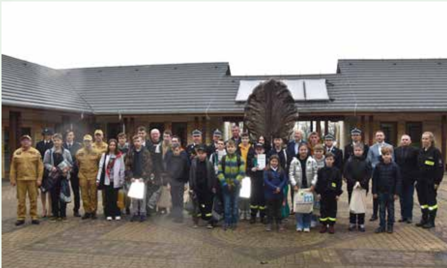
Laureaci eliminacji powiatowych Ogólnopolskiego Turnieju Wiedzy Pożarniczej

14 kwietnia w Śląskim Ogrodzie Botanicznym odbyły się powiatowe eliminacje do Ogólnopolskiego Turnieju Wiedzy Pożarniczej Młodzież Zapobiega Pożarom . Uczestniczyło w nich ponad 30 uczniów szkół podstawowych i ponadpodstawowych z powiatu mikołowskiego