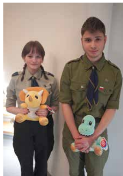
Harcerze, którzy od powstania łazickiego szczepu uczęszczają na zbiórki