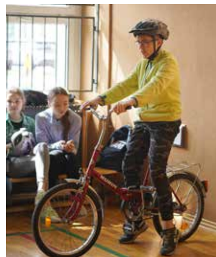
Jednym z zadań było pokonanie rowerem toru sprawnościowego