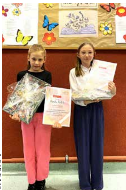
Laureatki XX Powiatowego Konkursu Poetyckiego Bez tytułu