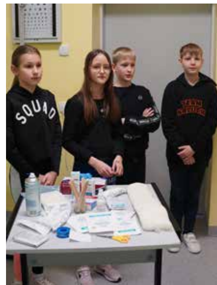
Uczestnicy turnieju musieli wykazać się wiedzą na temat udzielania pierwszej pomocy