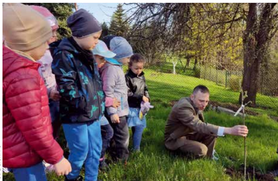
Wspólne sadzenie drzewa przedszkolaków z leśniczym