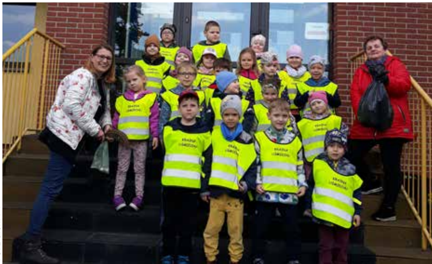
Motylki z „czwórki” porządkowały okolice przedszkola w Łaziskach Dolnych

Jak się okazało małych łaziszczan, uczęszczających do z Przedszkola nr 4, nie trzeba było zachęcać do takich działań. Przedszkolaki z grupy Motylki, podczas spaceru w okolicy przedszkola, zebrały worek śmieci, które wypatrzyły po drodze. Brawo! ❖ red.