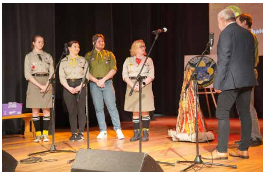
Podziękowania dla kadry łazickiego szczepu