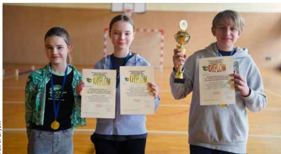
Drużyna z SP1 zdobyła I miejsce w kategorii wiekowej powyżej 12. roku życia