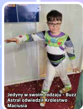
Jedyny w swoim rodzaju - Buzz Astral odwiedził Królestwo Macusia