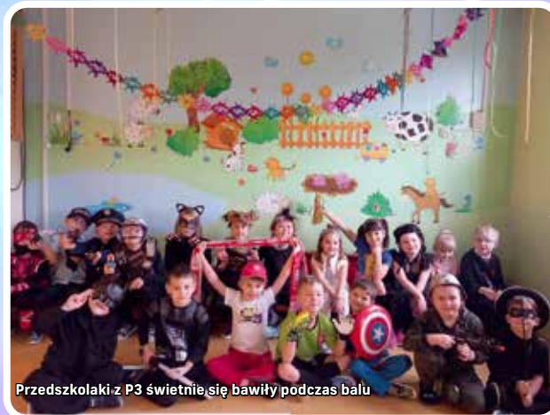
Przedszkolaki z P3 świetnie się bawiły podczas balu