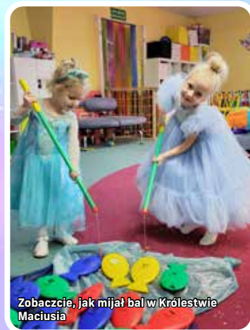
Zobaczcie, jak mijał bal w Królestwie Macusia