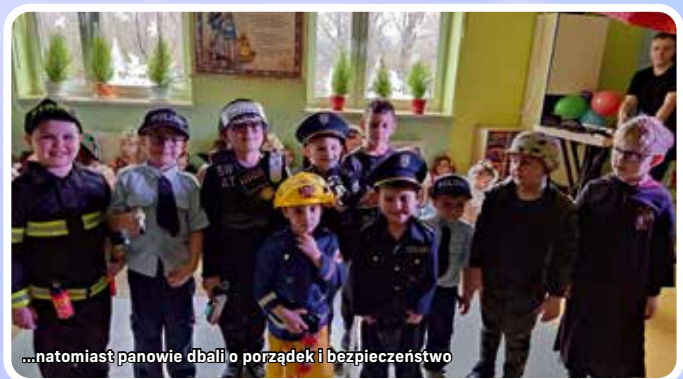
...natomiast panowie dbali o porządek i bezpieczeństwo