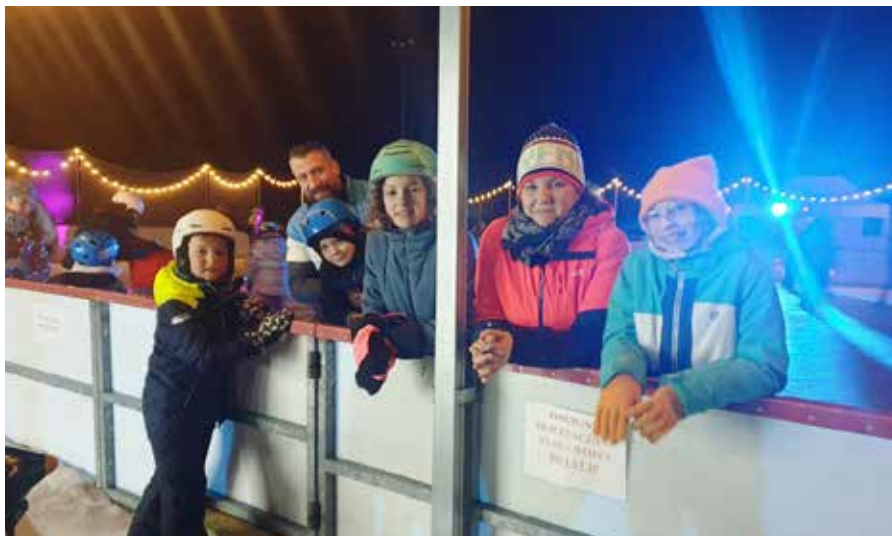
Walentynkowa dyskoteka na lodowisku ORS Żabka