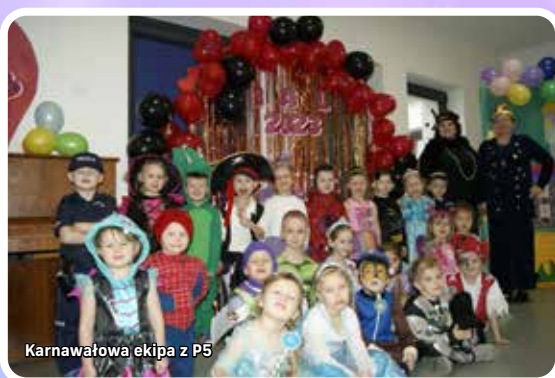
Karnawałowa ekipa z P5