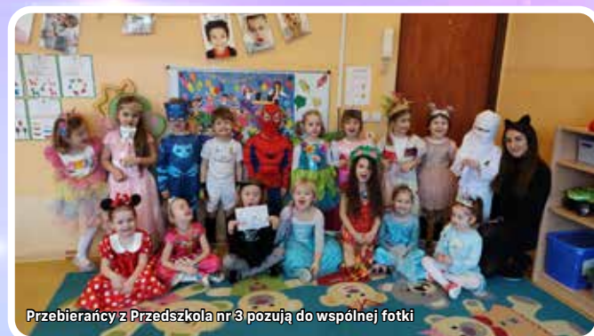
Przebierańcy z Przedszkola nr 3 pozują do wspólnej fotki