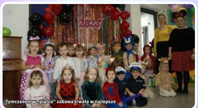
Tymczasem w „piątce” zabawa trwała w najlepsze