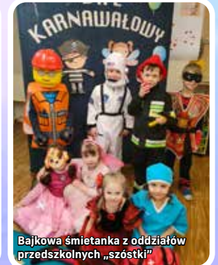
Bajkowa śmietanka z oddziałów przedszkolnych „szóstki”