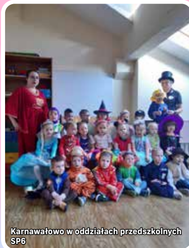
Karnawałowo w oddziałach przedszkolnych SP6