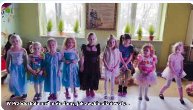
W Przedszkolu nr 3 małe damy, jak zwykle ośniwały...