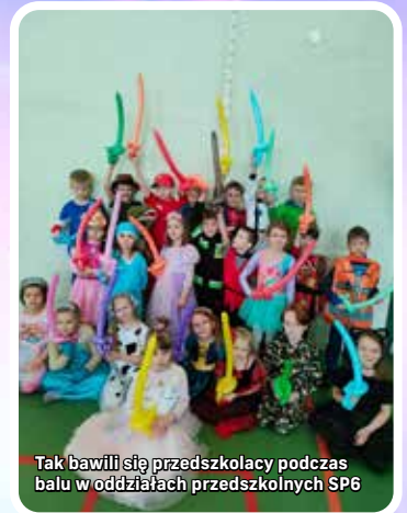
Tak bawili się przedszkolacy podczas balu w oddziałach przedszkolnych SP6