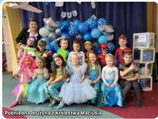
Podniebna drużyna z Królestwa Macusia