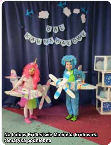
Na balu w Królestwie Macusia królowała tematyka podniebna

Choć karnawał już za nami, to na moment powracamy jeszcze wspomnieniami do roztańczonych, kolorowych balów. Zobaczmy, jak minęły bale przebierańców w laziskich placówkach – w tym numerze prezentujemy drugą część zdjęć z P3, P5, P7, Królestwa Macusia oraz oddziałów przedszkolnych w SP6