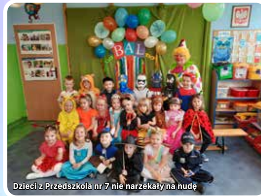
Dzieci z Przedszkola nr 7 nie narzekały na nudę