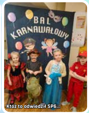
Któż to odwiedził SP6...