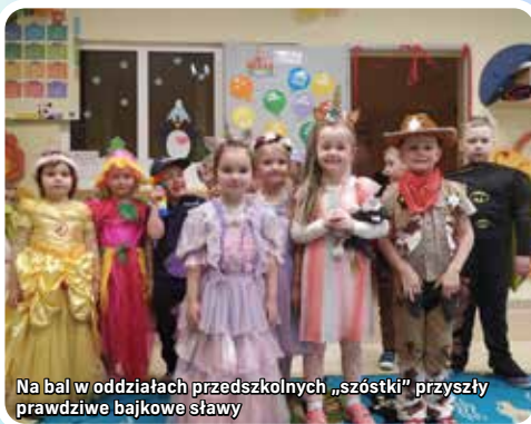
Na bal w oddziałach przedszkolnych „szóstki” przyszły prawdziwe bajkowe ślavy