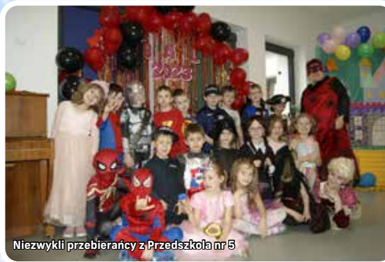
Niezwykli przebierańcy z Przedszkola nr 5