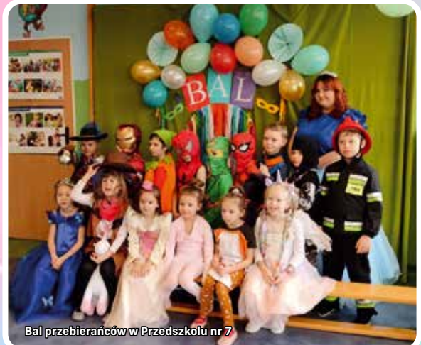
Bal przebierańców w Przedszkolu nr 7