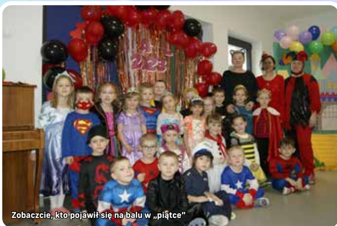
Zobaczcie, kto pojawił się na balu w „piątce”