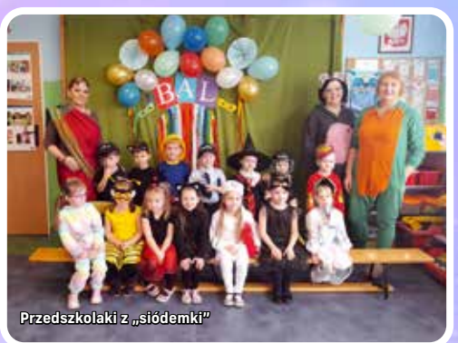
Przedszkolaki z „siódemki”