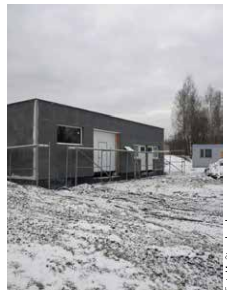
Przy boisku głównym powstaje budynek zaplecza