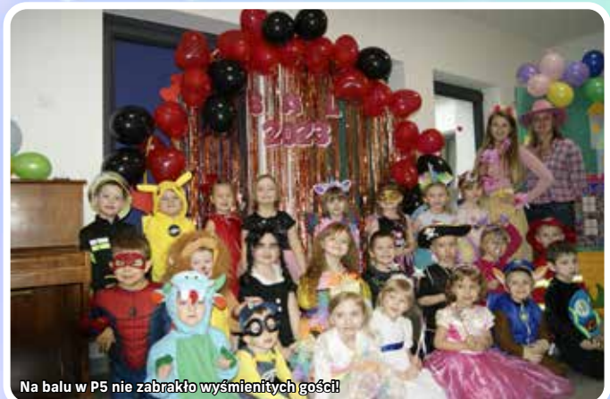
Na balu w P5 nie zabrakło wyśmienitych gości!