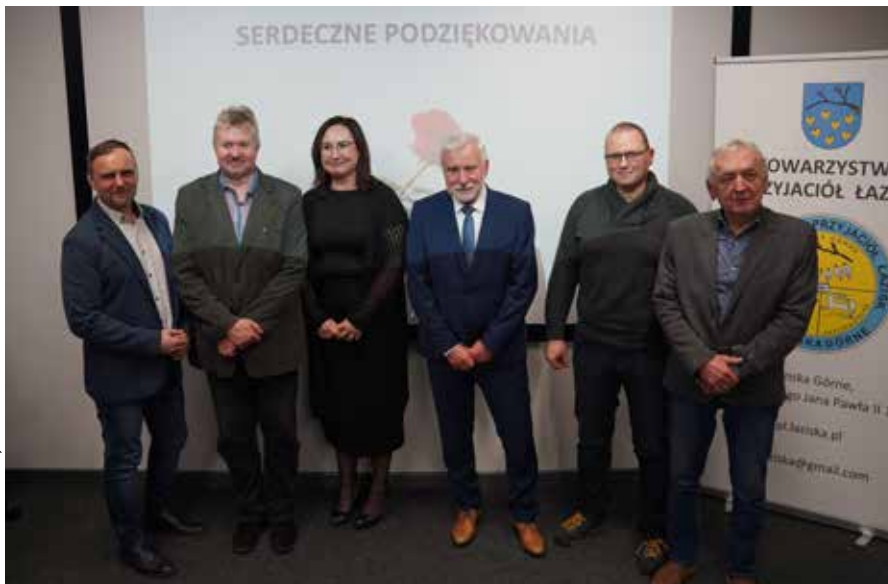
Członkowie Towarzystwa Przyjaciół Łazisk podczas uroczystych jubileuszowych obchodów