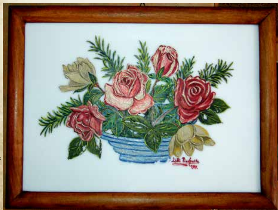
Kompozycja kwiatowa na szkłe