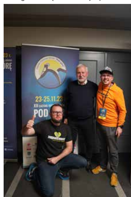
Festiwal odwiedziły władze miasta