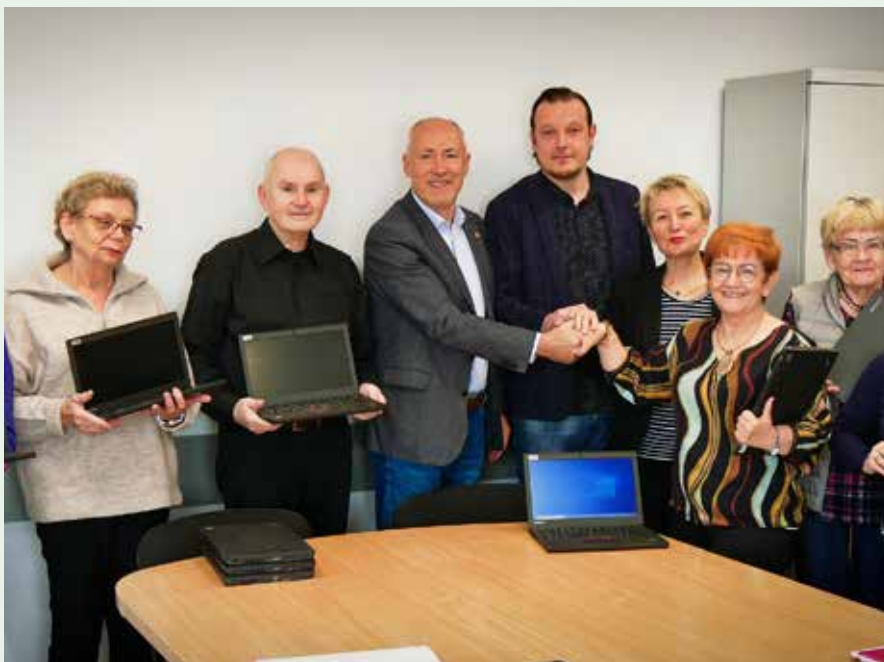
Sprzęt będzie wykorzystywany w trakcie kursów i warsztatów oferowanych przez PUTW

Warto nadmienić, że od niedawna zajęcia PUTW odbywają się w Centrum Aktywności Społecznej w Mikołowie, a kompaktowe przenośne notebooki są dobrym rozwiązaniem w przypadku częstych zmian sal wykładowych. ♦