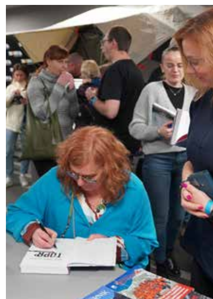
Była też okazja, aby zdobyć autograf swoich ulubionych autorów