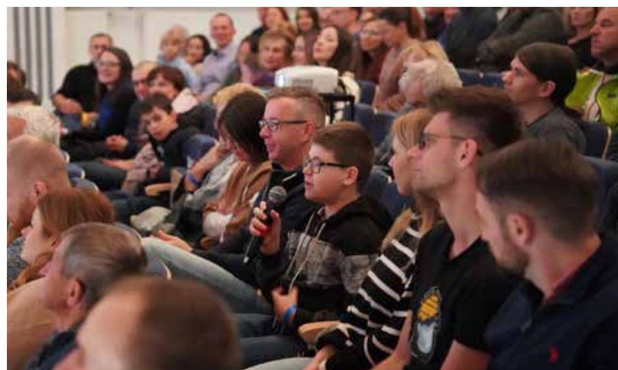
Po każdej prelekcji był czas na konkursy, pytania i rozmowy