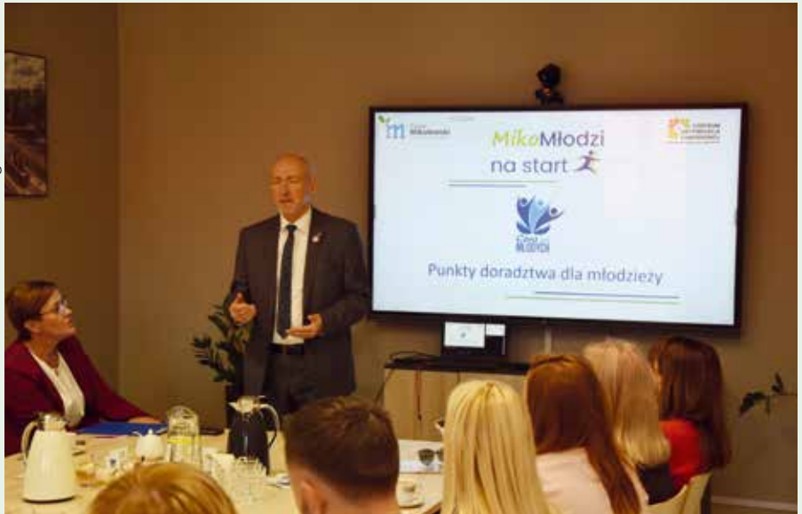
Inauguracja projektu odbyła się 11 października w mikołowskim Centrum Aktywności Społecznej

Powiatowy Urząd Pracy, Gmina Mikołów i Związek Stowarzyszeń Centrum Aktywności Społecznej rozpoczął w październiku realizację projektu MikoMłodzi na start , skierowanego do mieszkańców naszego powiatu w wieku od 18 do 29 lat zarejestrowanych w PUP jako poszukujący pracy bądź bezrobotni