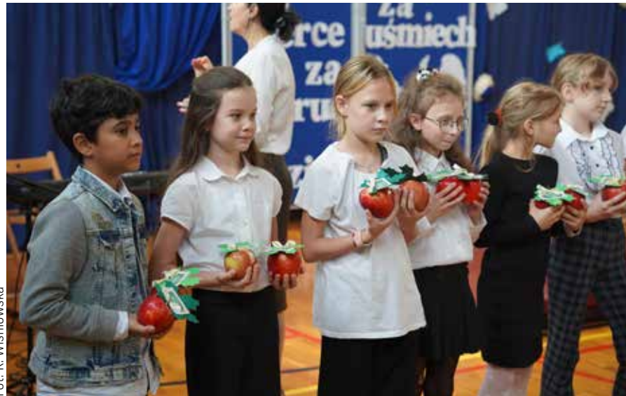
Uroczysta akademii z okazji Dnia Edukacji Narodowej