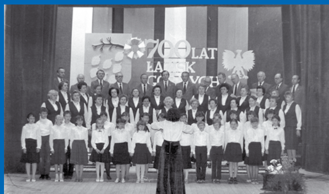
Obchody 700-lecia miasta stały się pretekstem powołania do życia Towarzystwa Przyjaciół Łazisk