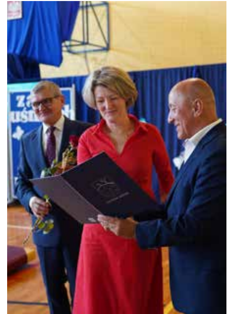
Podczas uroczystości wyróżniono 30 pracowników oświaty