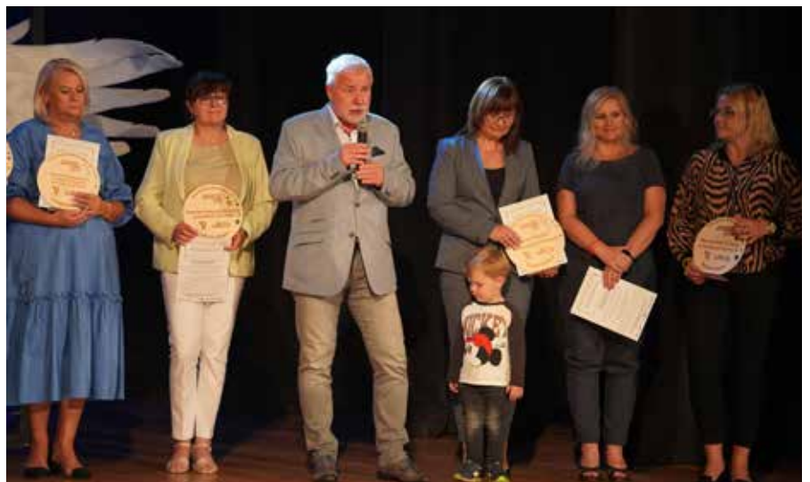
U honorowano osoby zaangażowane w realizację zadania

W MDK podsumowano projekt Fundacji Ulica