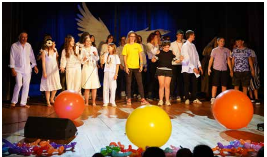
Podczas finału premierowo zaprezentowano teledysk, stworzony przez łaziską młodzież