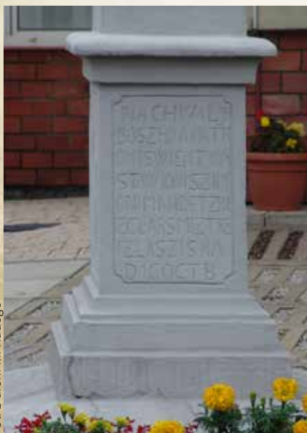
Cokół krzyża na Bradzie

Od pałaców bogactwa, które w świecie słynie, milsza nasza kapliczka bo na naszej wyżynie, na Bradzie. Wita krzyż, słońce i księżyc, i modlitwa własna. Jakiś mistrz ją budował, to mistrz nad mistrzami, Przetrwiała tyle wieków i Bóg jest zawsze z nami. A ty miły przechodniu Gdy Cię los skieruje w te strony, przystań u progu krzyża i bądź zamyślony.