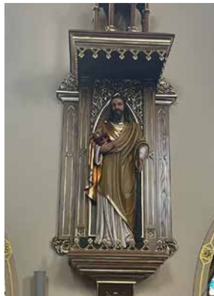
Figura św. Judy Tadeusza po renowacji

prace związane z instalacją instrumentu organowego i jego obudową, a także renowacją balustrady. ❖red.