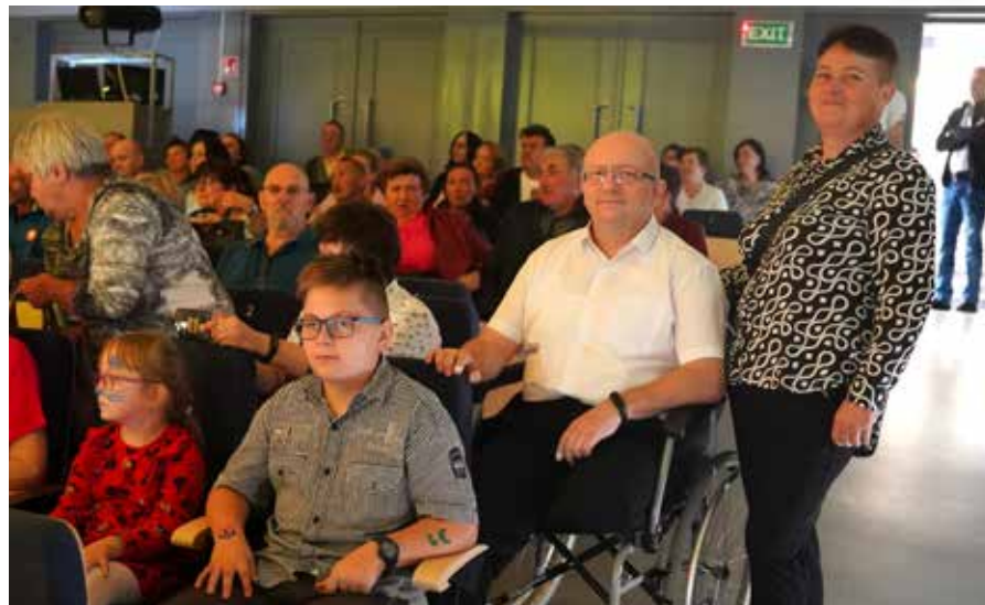
Rodzina państwa Herzog była wzruszona okazywanym przez mieszkańców wsparciem