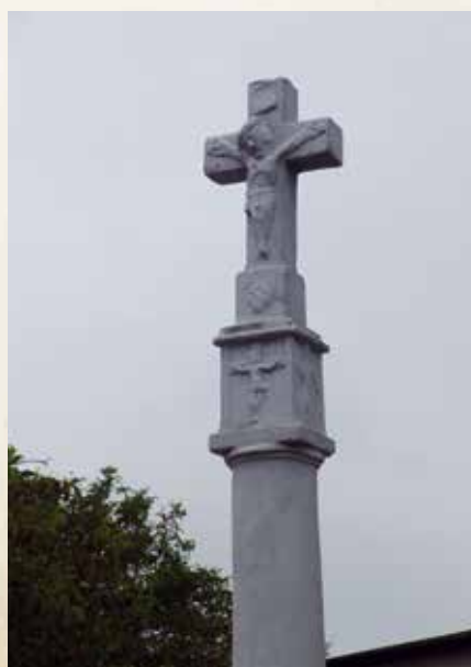
Zbliżenie na najstarszy zabytek w Łaziskach