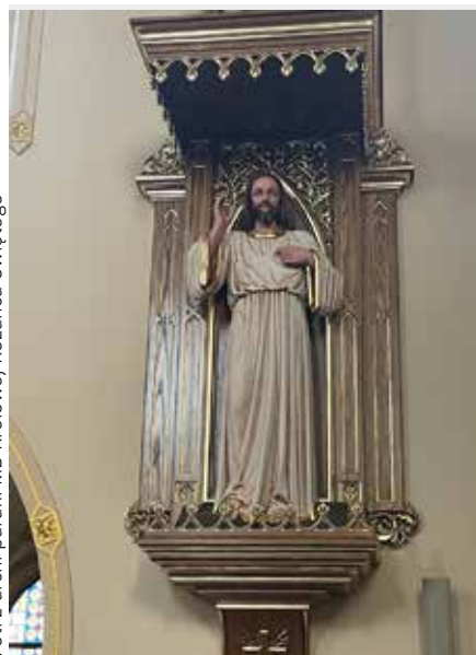
Odnowiona figura Jezusa w nawie głównej