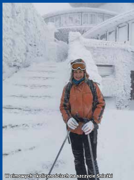
W zimowych okolicznościach na szczycie Śnieżki