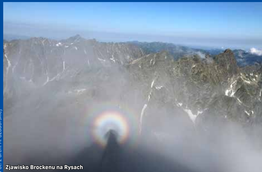
Zjawisko Brocenu na Rysach