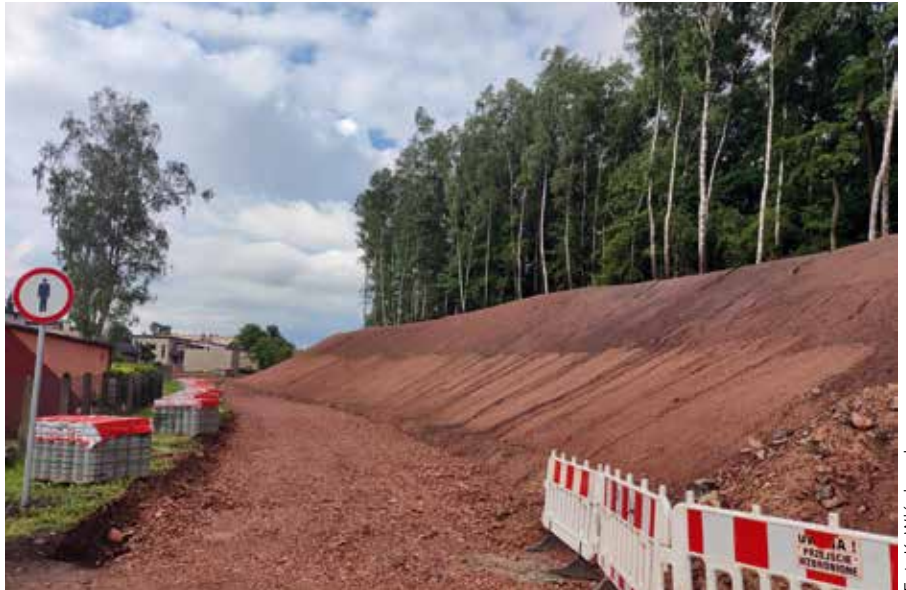
Zbocze hałdy przy ul. Sienkiewicza jest uformowane. Wkrótce zostanie pokryte humusem i obsiane trawą