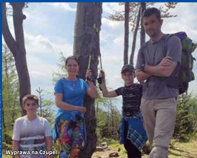
Wyprawa na Czupel

Przypomnijmy, że w gronie zdobywców KGP znajduje się obecnie 5154 miłośników górskich wypraw, wśród nich jest 14 łąziszczan. Chcąc zapisać się w gronie zdobywców korony, należy wejść na 28 wskazanych szczytów, a każdą z wypraw udokumentować w specjalnej książeczce – otrzymamy ją po wypełnieniu formularza na stronie www.kgp.info.pl , gdzie znajdziemy również wszystkie szczegółowe informacje na temat wyzwania