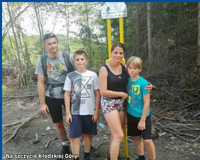
Na szczycie Kłodzkiej Góry