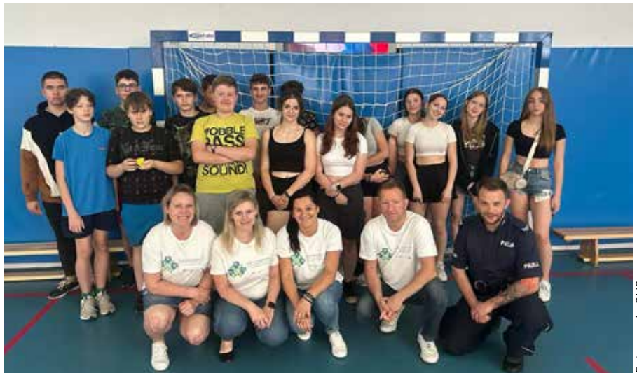
Uczniowie SP4 wzięli udział w warsztatach z wykorzystaniem alko- i narkogogli