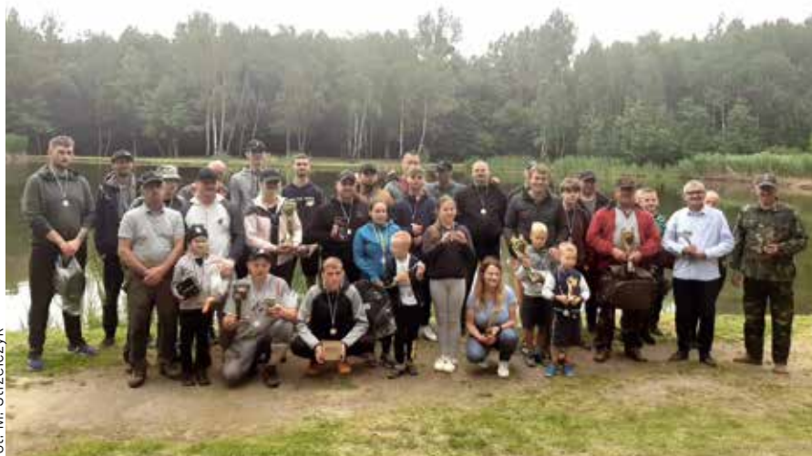
Pod koniec czerwca na Szustruku odbyły się VI zawody wędkarskie strażaków ochotników

Do gry w kategorii OPEN przystąpiło łącznie 25 zawodników i zawodniczek, którzy pojedynkowali się ze sobą do dwóch wygranych setów. Turniej rozegrano systemem pucharowym, a w wielkim finale – przełożonym na czwartek, 15 czerwca, z powodu niekorzystnych warunków pogodowych – zwyciężył Piotr Makowski , pokonując Zbigniewa Dyrbusia 6:4, 6:2. W kategorii kobiet triumfowała natomiast Izabela Wołek , która wygrała w finale z Lucyną Strzysmszok 6:2, 6:1. ❖bk