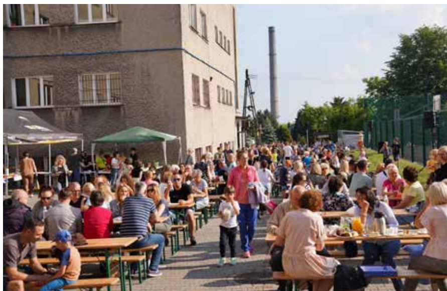
Podczas VII Rodzinnego Pikniku Piastowskiego frekwencja dopisała

Dziękujemy wszystkim za udział w uroczystościach jubileuszowych. Wyrazymy wdzięczności kierujemy w stronę naszych sponsorów oraz rodziców, których zaangażowanie i pomoc pozwoliły na tak uroczyste świętowanie urodzin „dwójki”.