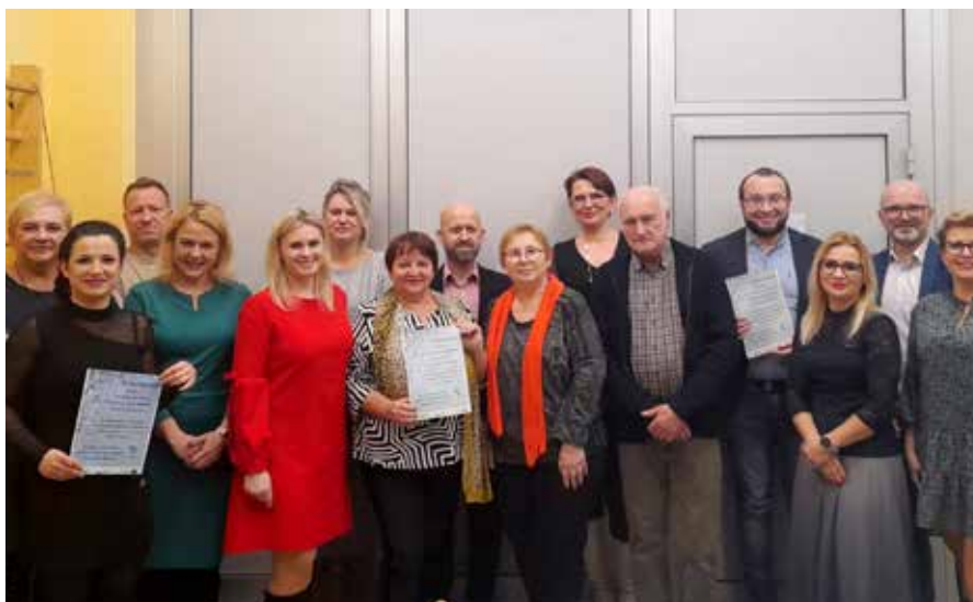
Grudniowe spotkanie z przedstawicielami organizacji zaangażowanych w projekt Rozwój usług społecznych dla mieszkańców Miasta Łaziska Górne świadczonych w ramach Centrum Usług Społecznych w Łaziskach Górnych

wości na 2023 rok pojawiła się usługa Aktywizacja 40+, w ramach której zainteresowani łaziszczanie będą mogli wziąć udział w przeróżnych warsztatach, kursach, w tym kursach zawodo-