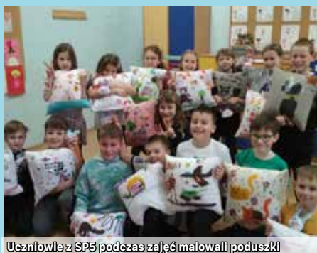
Uczniowie z SP5 podczas zajęć malowali poduszki