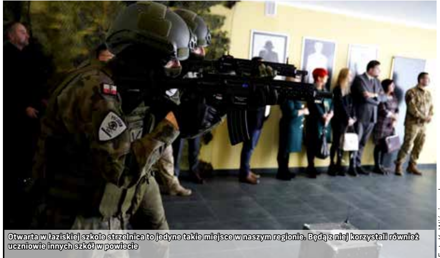
Otwarta w łaziskiej szkole strzelnica to jedyne takie miejsce w naszym regionie. Będą z niej korzystać również uczniowie innych szkół w powiecie

Najnowsza inwestycja, zrealizowana w Zespole Szkół Energetycznych i Usługowych w Łaziskach Górnych, to ciekawa propozycja, z której korzystać będą nie tylko uczniowie szkoły, ale całego powiatu. Wirtualna strzelnica powstała ze środków Ministerstwa Obrony Narodowej – 158 tys. zł oraz Starostwa Powiatowego w Mikołowie – 42 tys. zł. Uroczyste otwarcie strzelnicy odbyło się 13 stycznia w towarzystwie przedstawicieli oświaty, policji i władz powiatowych oraz samorządowych