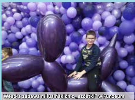
Wesoła zabawa milusińskich z „szóstki” w Funzeum