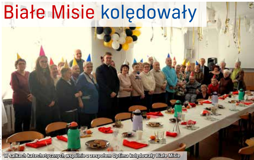
W salkach katechetycznych wspólnie z zespołem Optima kolędownały Białe Misie

W przedostatni weekend stycznia dom katechetyczny przy parafii w Łaziskach Górnych wypełniły dźwięki wspólnego śpiewu, nie zabrakło też tańców! W sobotnie południe, 21 stycznia, w salkach spotkali się członkowie Stowarzyszenie na rzecz Osób Niepełnosprawnych Białe Misie, aby razem kolędownały i powitały karnawał. Radosną zabawę tradycyjnie poprowadził zespół Optima. ❖jb