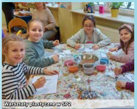
Warsztaty plastyczne w SP2