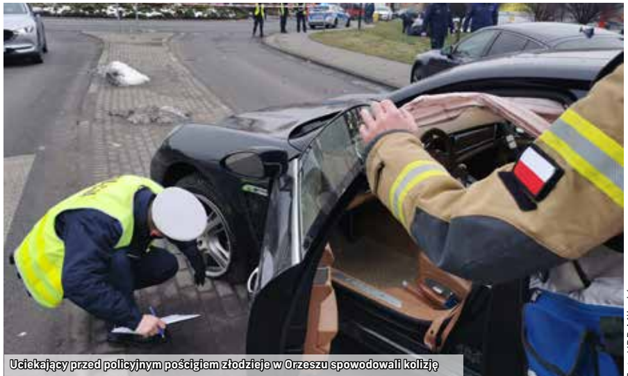
Uciekający przed policyjnym pościgiem złodzieje w Orzeszu spowodowali kolizję

wiatowej Policji w Mikołowie. W trakcie czynności weryfikacyjnych kierowca nagle ruszył i zaczął uciekać. Policjanci podjęli za nim pościg. Samochód kierował się w stronę Orzesza. Szybko do pościgu przyłączyli się policjanci KMP Rybnik. O 9.25