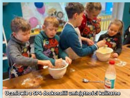
Uczniowie z SP4 doskonalili umiejętności kulinarne