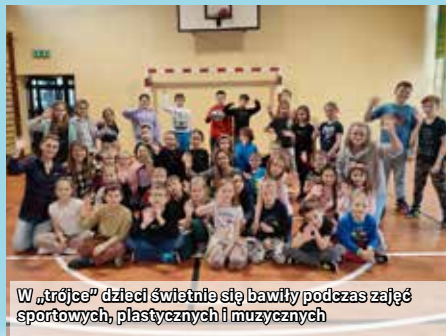
W „trójce” dzieci świetnie się bawili podczas zajęć sportowych, plastycznych i muzycznych