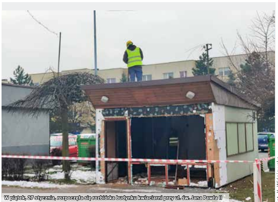
W piątek, 27 stycznia, rozpoczęła się rozbiórka budynku kwiaciarni przy ul. św. Jana Pawła II