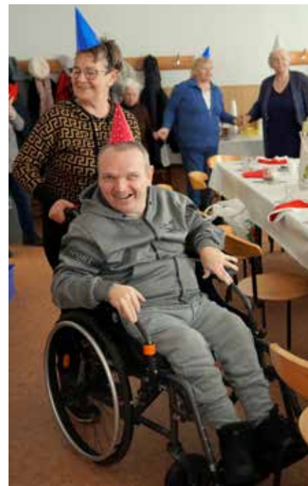
Wspólne kolędownie Białych Misów to już tradycja

W przedostatni weekend stycznia dom katechetyczny przy parafii w Łaziskach Górnych wypełniły dźwięki wspólnego śpiewu, nie zabrakło też tańców! W sobotnie południe, 21 stycznia, w salkach spotkali się członkowie Stowarzyszenie na rzecz Osób Niepełnosprawnych Białe Misie, aby razem kolędownały i powitały karnawał. Radosną zabawę tradycyjnie poprowadził zespół Optima. ❖jb