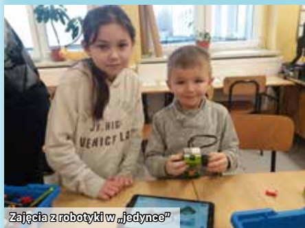
Zajęcia z robotyki w „Jedynce”

Zimowy czas minął pod znakiem dobrej zabawy wśród uczniów łaziskich szkół podstawowych. W placówkach przygotowano dla nich wiele atrakcji. Każda ze szkół zorganizowała półkolonie, podczas których dzieci miały okazję zwiedzić niezwykle miejsca, były też ciekawe zajęcia i warsztaty w murach szkoły. Pewne jest jedno – nikt się nie nudził! Zobaczcie, jak ferie spędzili uczniowie z łaziskich szkół