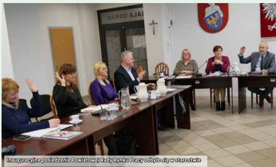
Inauguracyjne posiedzenie Powiatowej Rady Rynku Pracy odbyło się w starostwie

Stopa bezrobocia w naszym powiecie na koniec listopada 2022 r. wynosiła 2,7 (dla porównania: w woj. śląskim – 3,6, zaś w kraju – 5,1). ♦