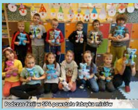
Podczas ferii w SP4 powstała fabryka misiów