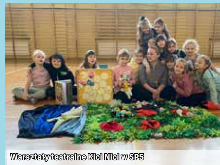
Warsztaty teatralne Kieci Nici w SP5