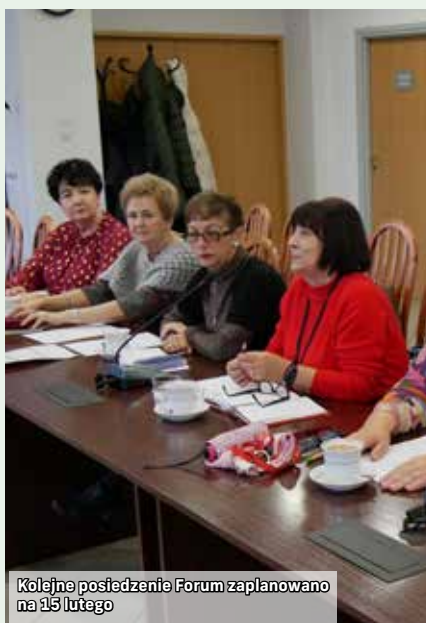
Kolejne posiedzenie Forum zaplanowano na 15 lutego

18 stycznia na pierwszym w 2023 roku, posiedzeniu w starostwie zebrało się Forum Seniorów Powiatu Mikołowskiego. Tematem przewodnim IX posiedzenia była współpraca tego gremium z Zarządzeniem i Radą Powiatu Mikołowskiego w celu lepszego zaspokojenia potrzeb seniorów.