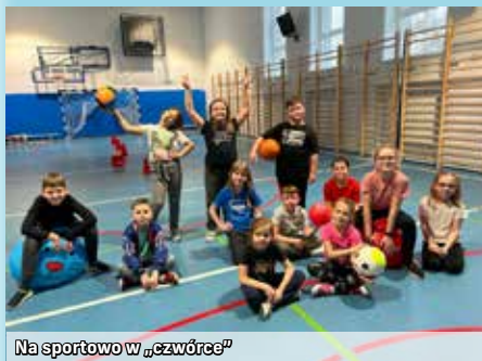
Na sportowo w „czwórce”