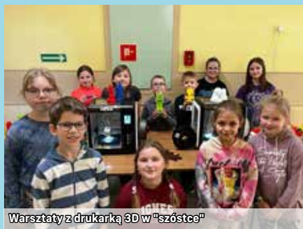
Warsztaty z drukarką 3D w „szóstce”