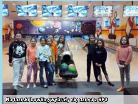
Na łaziski bowling wybrały się dzieci z SP3