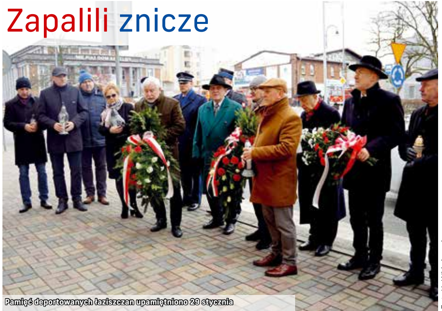
Pamięć deportowanych łaziszczan upamiętniono 29 stycznia