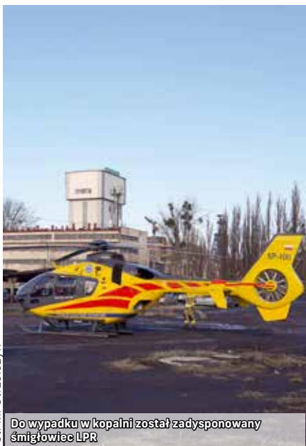
Do wypadku w kopalni został zadysponowany śmigłowiec LPR

W sobotę, 14 stycznia, po godz. 9.00 na dole w kopalni Bolesław Śmiały doszło do wypadku. Jak informuje rzecznik prasowy Polskiej Grupy Górniczej Tomasz Głogowski , do zdarzenia doszło na dole w chodniku badawczym 623. Podczas porotu pracowników ze zmiany kolejną podwieszoną, jeden z nich doznał urazu nogi – mówił rzecznik PGG. Rannemu górnikowi pierwszej pomocy udzielili ratownicy, a potem lekarz, który zjechał na dół. Na powierzchni czekała już karetka, wezwano także śmigłowiec LPR. Mężczyzna został przetransportowany na powierzchnię i przewieziony karetką do szpitala. Jego życiu nie zagrażało niebezpieczeństwo. ❖red.