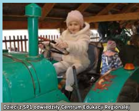
Dzieci z SP1 odwiedziły Centrum Edukacji Regionalnej