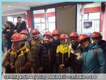
Sztolnię królowej Luizy odwiedzili uczniowie z SP6