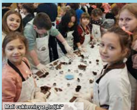
Mali cukiernicy z „trójki”