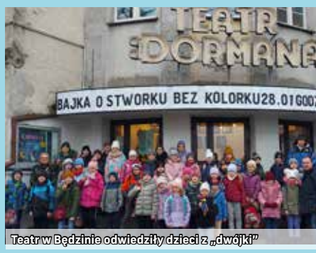
Teatr w Będzinie odwiedzili dzieci z „dwójki”