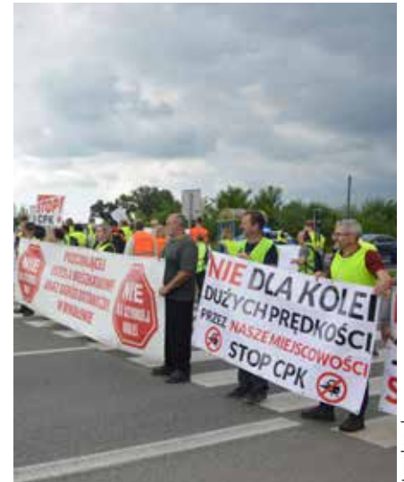
Przeciwko proponowanym wariantom trasy linii 170 solidarnie protestują wszystkie gminy powiatu mikołowskiego oraz sąsiednie miejscowości