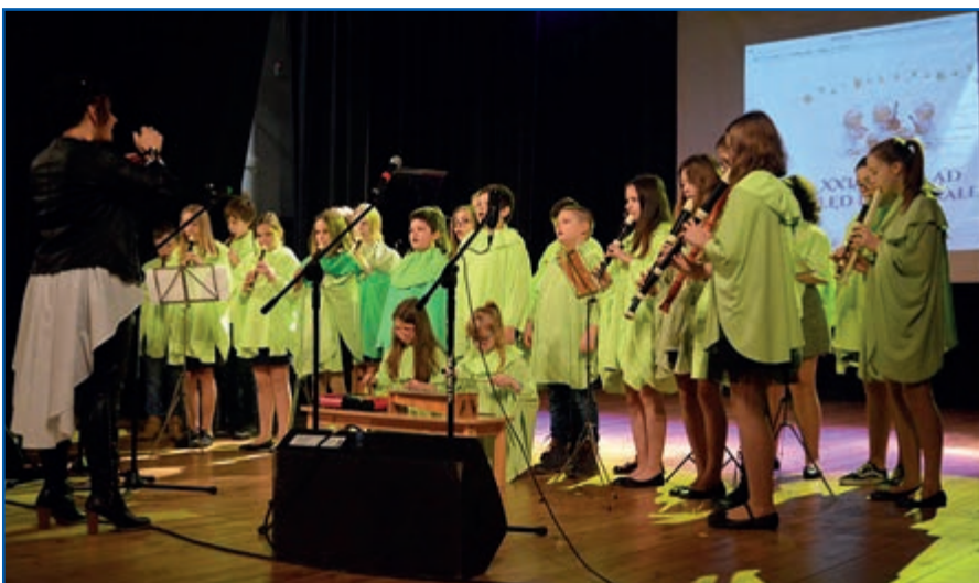
Zielone Pólnutki z SP2