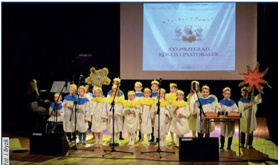
Zespół Integracyjny z kl. Ia łaziskiej SP6