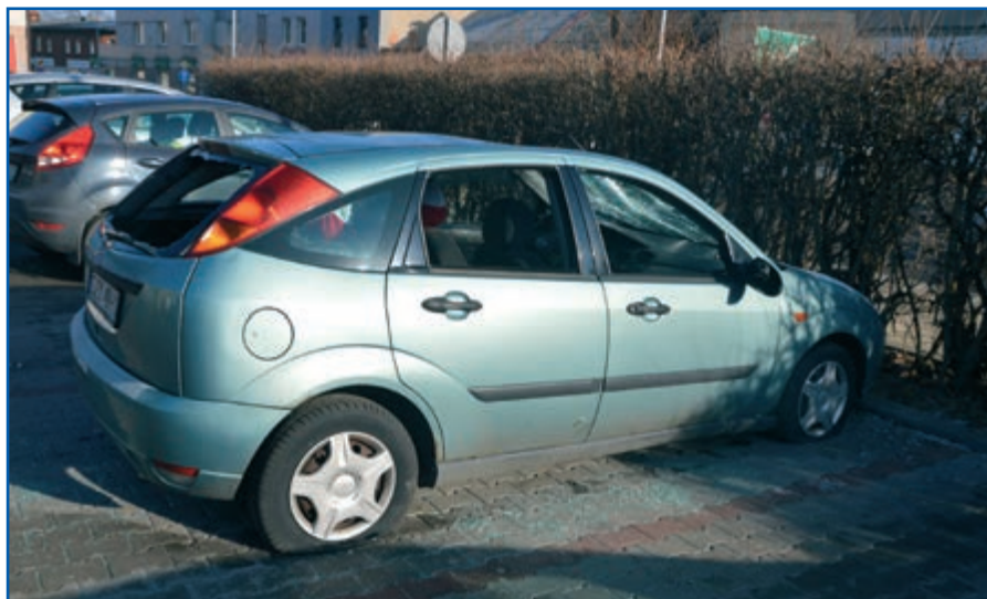
Zniszczony samochód stoi na parkingu i blokuje miejsce