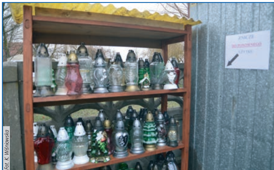
Przy kontenerze na śmieci w parafii w Łaziskach Górnych pojawił się regał do składowania zniczy nadających się do ponownego użytku