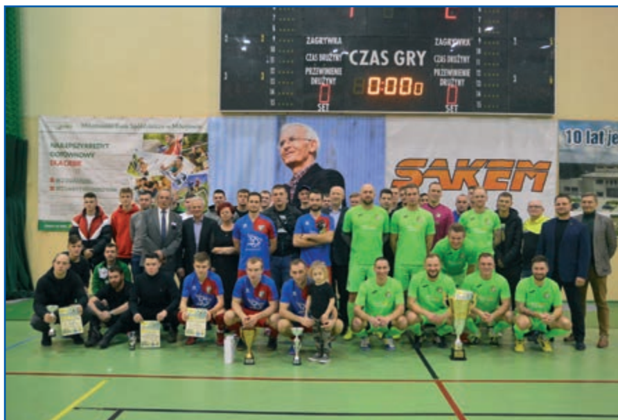
W VIII Powiatowym Turnieju Piłki Nożnej im. A. Chrószcza wzięło udział 10 drużyn