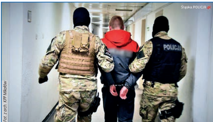
Dwie doby po eksplozji zatrzymani zostali pierwsi podejrzani

tworzenie bez zezwolenia broni i amunicji, kradzieże i groźby. Pozostałe osoby są odpowiedzialne za przewiezienie plecaka z niebezpieczną zawartością na miejsce oraz za podłożenie ładunku wybuchowego na taras domu. Policjanci ustalają powód działania sprawców. Nie wykluczają, że motywem były rozliczenia finansowe. Zatrzymane osoby zostały