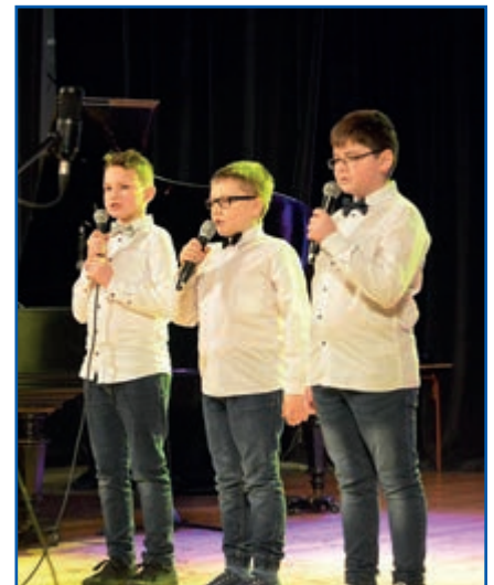
Trio chłopięce z SP4