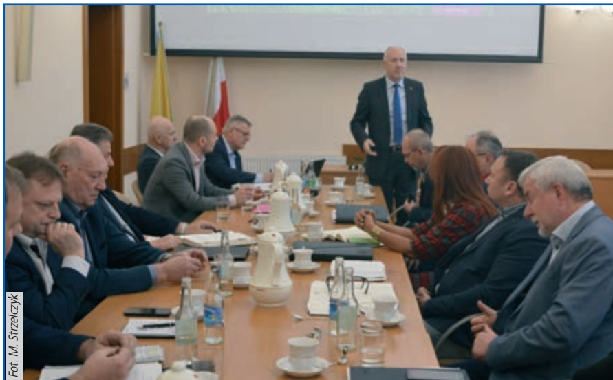
O przyszłości Elektrowni Łaziska dyskutowano podczas spotkania w łaziskim urzędzie