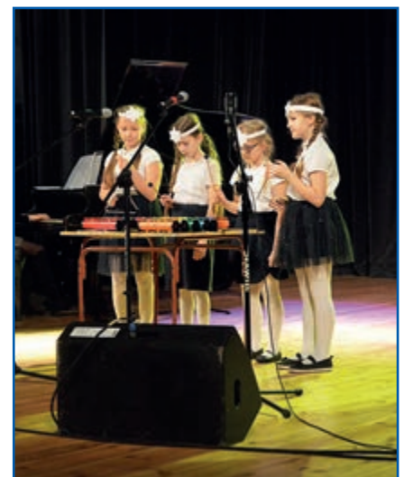
Kwartet z „szóstki”