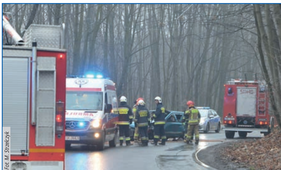
Zderzenie samochodów osobowych na ul. św. Barbary

W związku z trudnymi warunkami na drogach, policja apeluje o szczególną ostrożność i ściąganie nogi z gazu. Oms