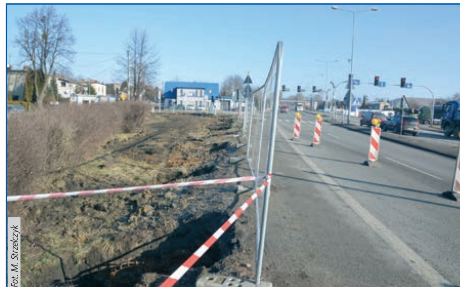
Przy ul. Cieszyńskiej powstają ekrany dźwiękochłonne

W końcu się doczekali. Mieszkańcy ulicy Cieszyńskiej od trzech tygodni obserwują ze swoich okien budowę ekranów dźwiękochłonnych. Firma na zlecenie