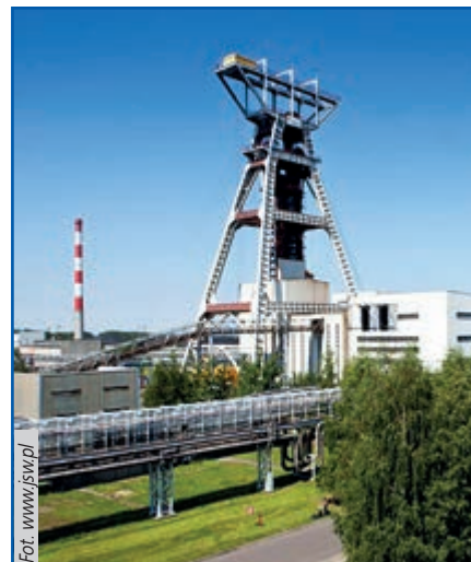
Do częstych wstrząsów dochodzi w okolicy kopalni Budryk