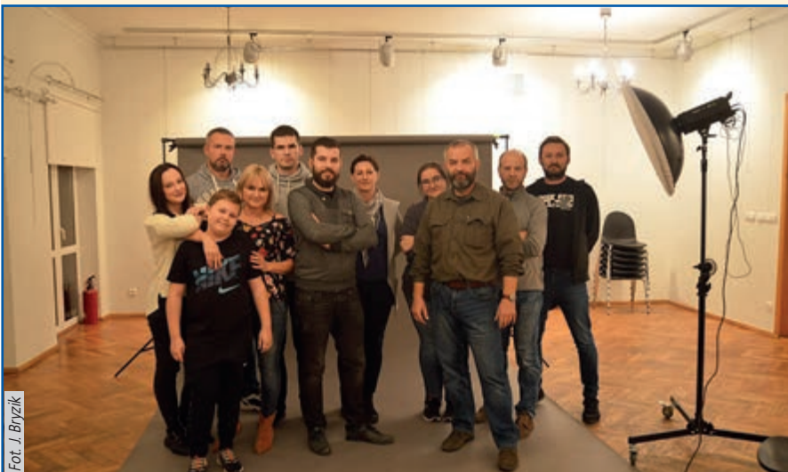
Koło fotograficzne M42