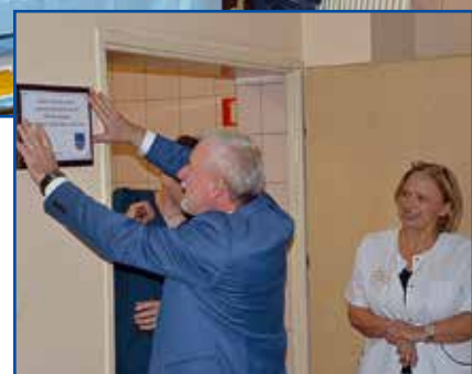
25 tys. zł na ten cel zostało przekazane z budżetu Łazisk Górnych

wództwa pozyskaliśmy 320 tys. zł, dzięki temu kupiliśmy między innymi nową karetę transportową. Ta, która była przez nas do tej pory wykorzystywana, miała już ponad 300 tys. kilometrów przebiegu – informuje Władysław Perchaluk. Oms