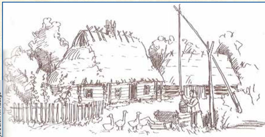
rys. z arch. M. Rudego

tacji było wcześniejsze podzielenie sołectwa w Łaziskach Dolnych na dwa gospodarstwa. Nie zachowały się jednak imiona poprzednich osób piastujących to stanowisko. Oprócz wspomnianych gospodarstw w tej miejscowości istniało wówczas aż pięć pustek. Były one uprawiane przez wymienionych sołtysów. Wszyscy łaziscy gospodarze wymienieni w urbarzu, oprócz czynszu, musieli dostarczyć co roku do Pszczyzny dwie furmanki siana. Byli też zobowiązani służyć tamtejszemu panu w zależności od jego potrzeb. Ponadto, jeśli np. zajmowali się dodatkowo pszczelarstwem, wyrabianiem kół do wozów, gontów czy sit, mieli płacić osobny czynsz.