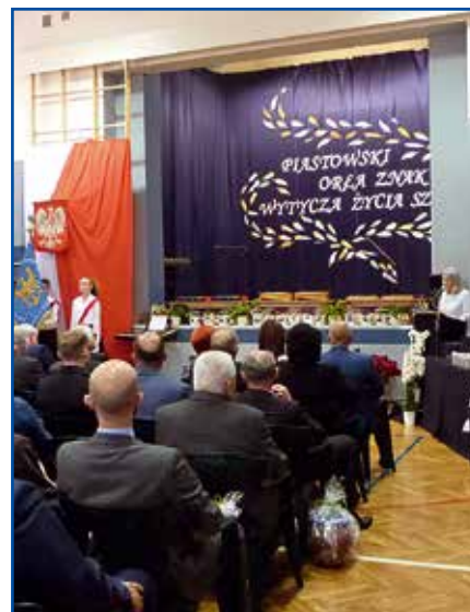
80-lecie SP2 obchodzone było bardzo uroczystie