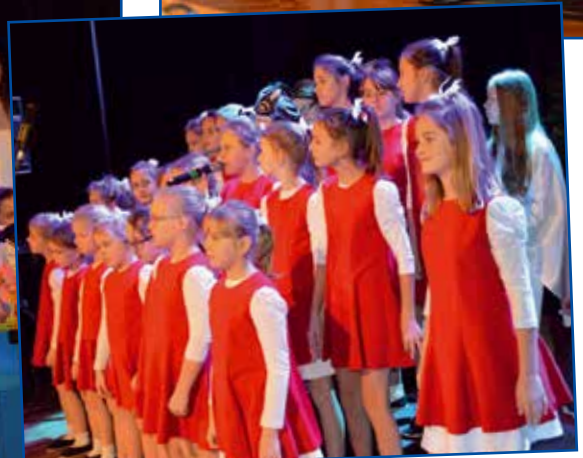
Zespół Radość podczas koncertu