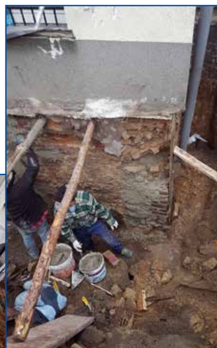
Prace przy izolacji budynku rozpoczęły się w listopadzie