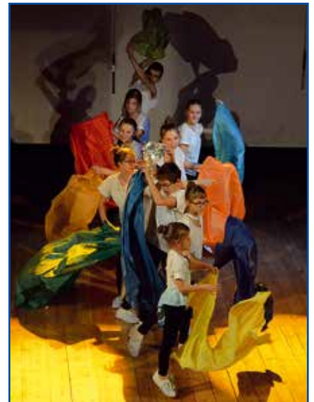
Na scenie było wesoło i kolorowo