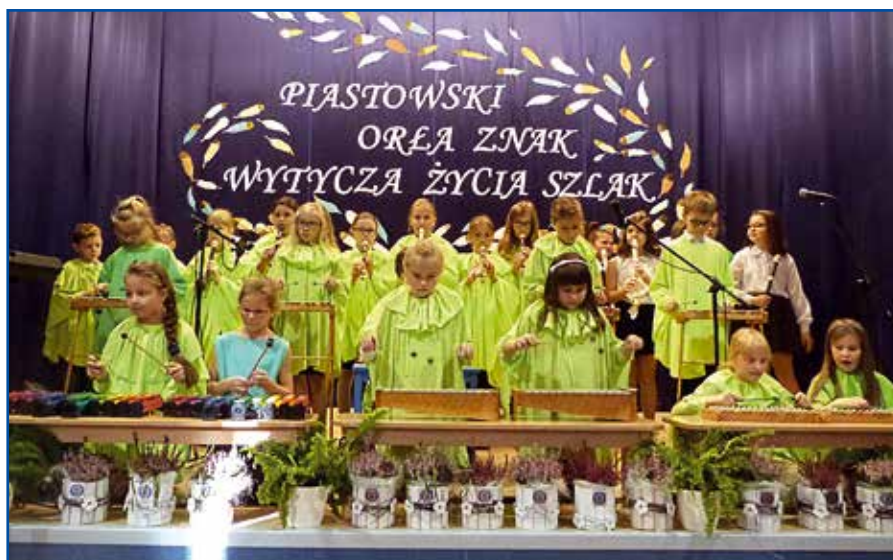
Program artystyczny w wykonaniu obecnych uczniów „dwójki”