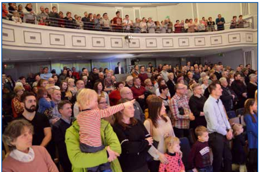
Sala Miejskiego Domu Kultury wypełniona była po brzegi

Członkowie zespołu Logos to młodzi ludzie z wielką pasją