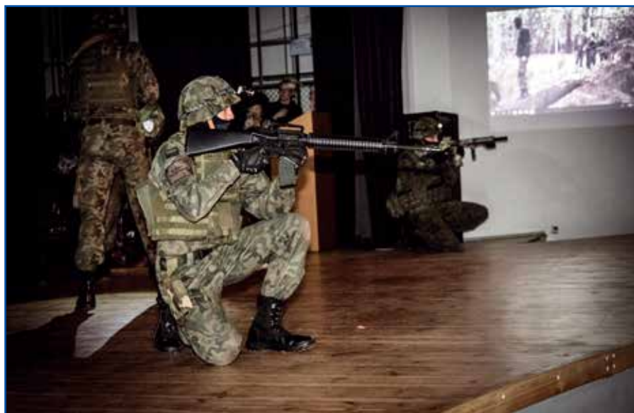
Pokaz w wykonaniu uczniów klasy mundurowej z ZSEiU