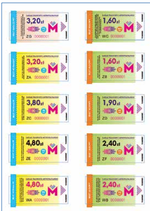
Nowe wzory biletów

Zarząd Transportu Metropolitalnego, ul. Barbary 21a, 40-053 Katowice. Infolinia czynna w dni robocze w godz. 6.00–22.00, w soboty, niedziele i święta w godz. 7.00–15.00. Bezpłatny numer 800 16 30 30, numery płatne (opłaty wg taryfy operatora) 32 74 38 446, 42 291 04 05, fax 32 25 19 745, e-mail: kancelaria@metropoliaztm.pl . Blokada karty SKUP 24h 42 291 04 05, 800 16 30 30.