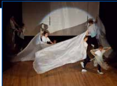
Członkowie Teatru Baza zabrali widzów w kosmiczną podróż