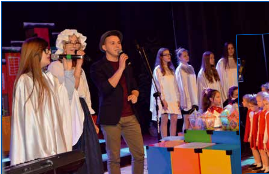
Fot. J. Pasierbek-Konieczny