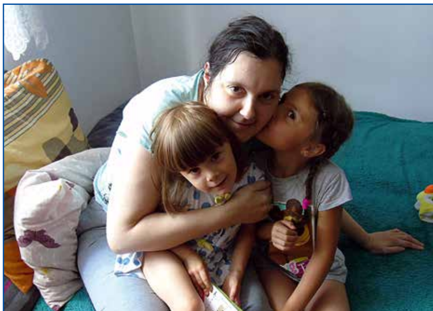
Całe życie rodziny toczy się w jednym pokoju

żyć. Siły do walki dodają jej nie tylko córeczki, ale też świadomość, że są wokół niej ludzie gotowi nieść pomoc. Nasza bohaterka jest pod opieką Fundacji Stonoga, za pośrednictwem której można wpłacać środki na rehabilitację. Nato-