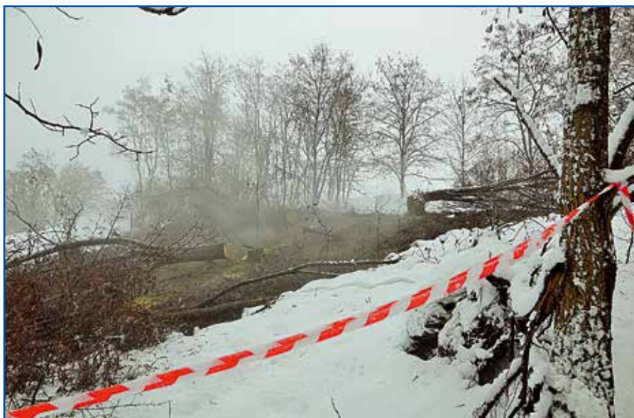
W ramach przygotowania do dalszych prac wycięto drzewa na zboczu hałdy