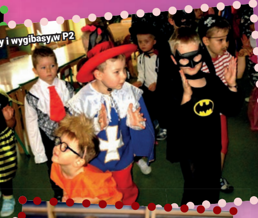
Wygibasy w P2

księżniczek pojawiły się na balach karnawałowych przedszkolnych. Sale placówek tego dnia potkać można było niemalże każdą baśniową postać. Wśród najmłodszych nie mogło zabraknąć policjantów, wygibasom, piruatom nie było końca. Zapraszamy na terenie naszego miasta