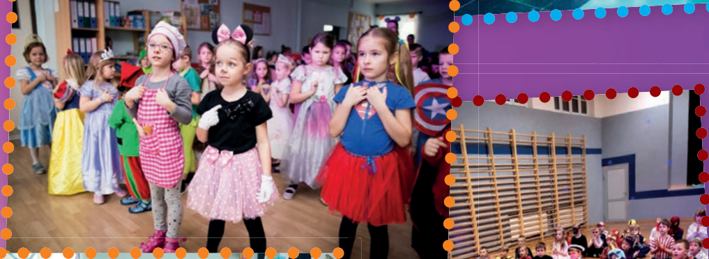
W kolorowych strojach dzieciaki z P5