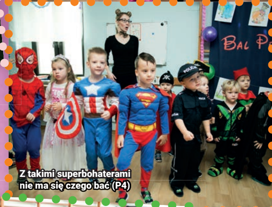
Z takimi superbohaterami nie ma się czego bać (P4)