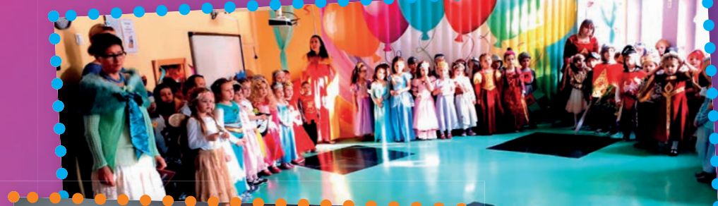
Zapraszamy na parkiet (P4)