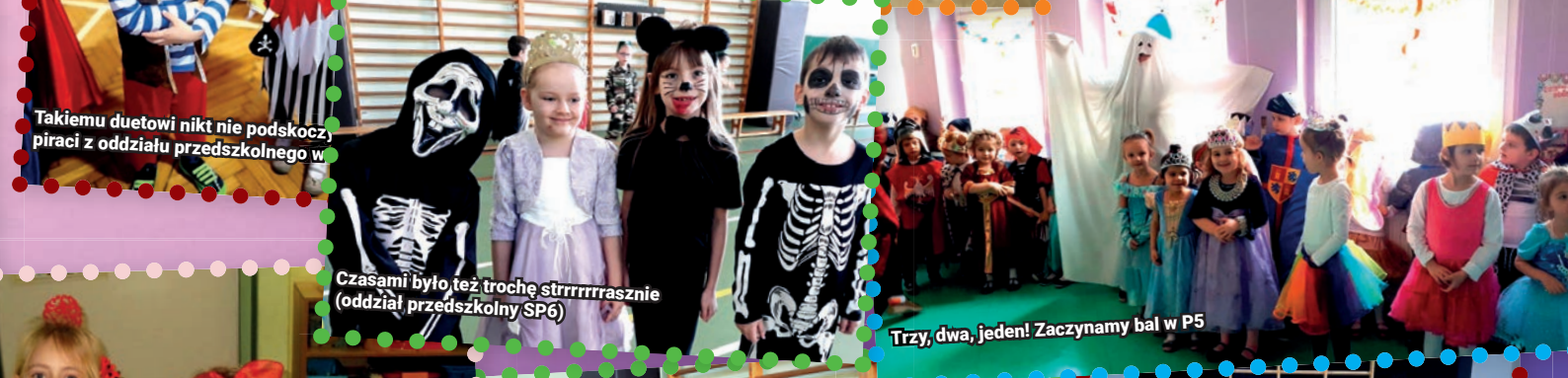
Czasami było też trochę strrrrrrasnie (oddział przedszkolny SP6)