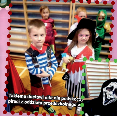
Takiemu duetowi nikt nie podskoczy, piraci z oddziału przedszkolnego w P2