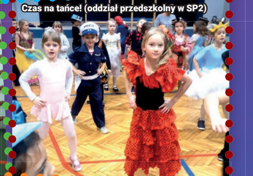
Czas na tańce! (oddział przedszkolny w SP2)