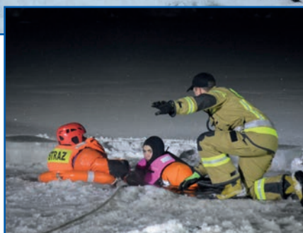
Ćwiczenia z zakresu ratownictwa lodowego prowadzono również w warunkach nocnych

wykorzystany do ewakuacji osób znajdujących się w wodzie po załamaniu lodu. Są to m.in. drabiny, z których można tworzyć trapy, kamizelki asekuracyjne, koła ratunkowe, 20-metrowe linki ratownicze, bosaki czy deski ortopedyczne, które mogą być alternatywą do sań lodowych. Żadna z wymienionych rzeczy nie zastąpi w 100% sprzętu strictly przeznaczonego do ratownictwa lodowego, ale w sytuacji zagrożenia życia można ją wykorzystać. Mam nadzieję, że w przyszłym sezonie zimowym to się zmieni, przynajmniej w naszej jednostce, dzięki realizowanemu przez Urząd Miejski unijnemu projektowi, którego celem jest doposażenie łaziskich Ochotniczych Straży Pożar-