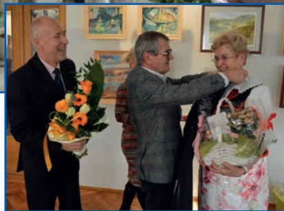
Przewodniczący RM wręczył gospodyniom pamiątkowe fartuchy

Dzisiaj gospodynie spotykają się raz w miesiącu, organizują sobie Dzień Kobiet, ostatki, andrzejki czy spotkanie opłatkowe. Choć wiele z kultywowanych do niedawna tradycji odeszło już do lamusa, panie starają się dbać o śląskość – pielęgnować gwarę, a podczas uroczystości miejskich występują w śląskich strojach. Nie inaczej było podczas uroczystości 60-lecia istnienia w piątek,