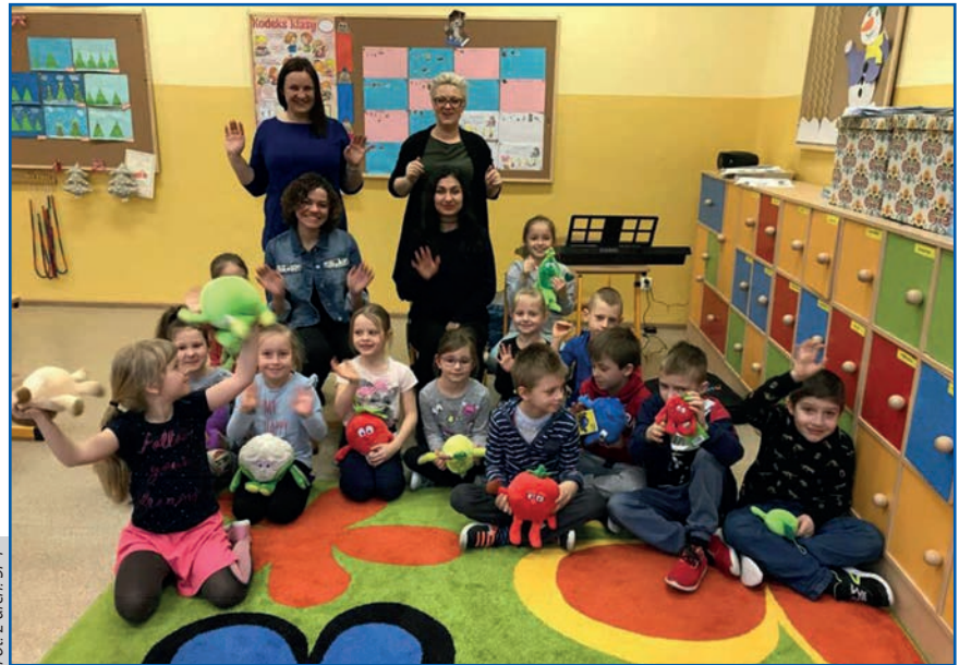
W Szkole Podstawowej nr 4 pojawili się niecodzienni goście