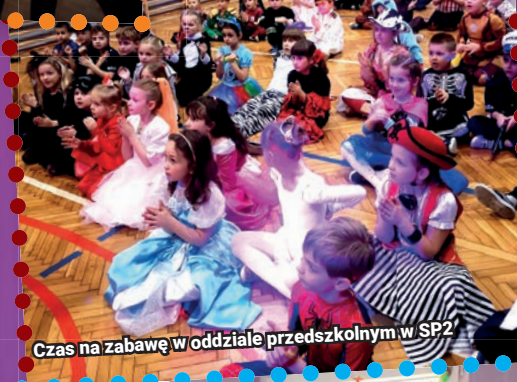
Czas na zabawę w oddziale przedszkolnym w SP2