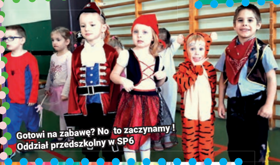
Gotowi na zabawę? No to zaczynamy! Oddział przedszkolny w SP6