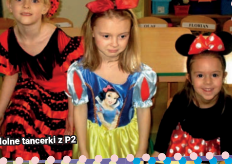
Wolne tancerki z P2