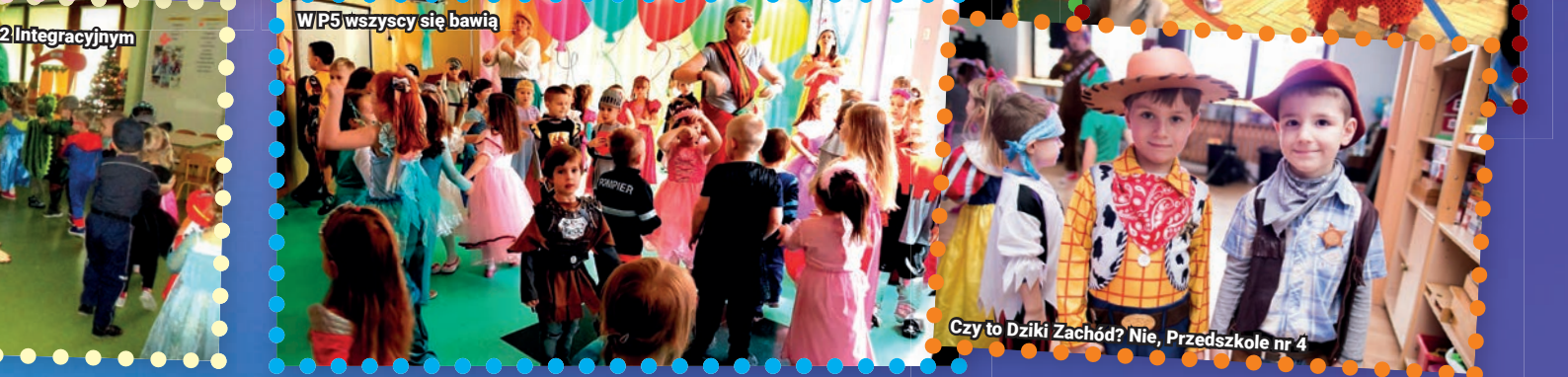
W P5 wszyscy się bawią