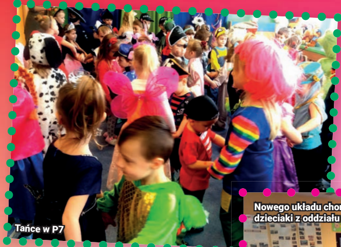
Tańce w P7

Spiderman, myszka Minnie, Batman, żółwie ninja i tuziny innych postaci organizowanych w łaziskich przedszkolach i oddziałach na moment zamieniły się w czarodziejskie krainy, gdzie są nie tylko postaci, ale nie tylko. Jak co roku, na imprezach dla najmłodszych strażaków, tancerek czy przeróżnych zwierząt. Płasom, w tym na fotorelację z balów organizowanych w