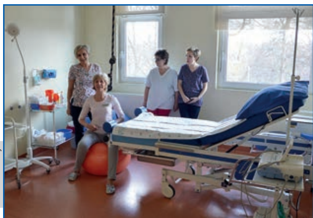
Położne na jednej z sal porodowych