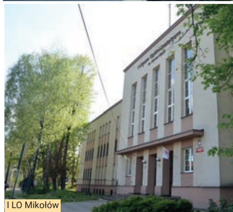
I LO Mikołów