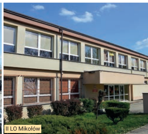
II LO Mikołów