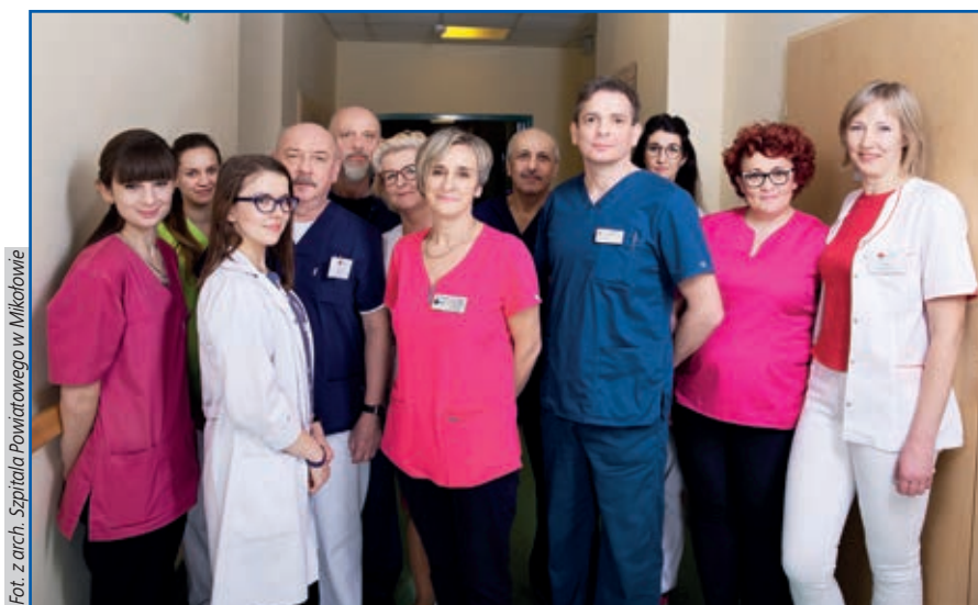
Pracownicy Oddziału Ginekologiczno-Położniczego Szpitala Powiatowego w Mikołowie

R. K.: Nie ma czegoś takiego, jak cesarka na życzenie. Jeżeli pacjentka informuje nas, że chciałaby cesarskie cięcie, to staramy się dojść do tego, dlaczego. Podczas takiej rozmowy może się okazać, że ma rację. Wskazaniami medycznymi do przeprowadzenia cesarskiego cięcia jest np. fakt, że pacjentka wielokrotnie poroniła lub jest po 40. Jest też grupa pacjentek, które są tak nieprzygotowane emocjonalnie do porodu i bólu porodowego, że otrzymują zaświadczenie od leka-