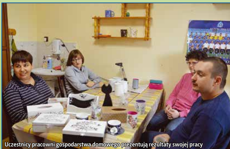
Uczestnicy pracowni gospodarstwa domowego prezentują rezultaty swojej pracy