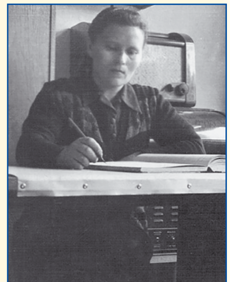
Prawdopodobnie pierwsza kierowniczka przedszkola