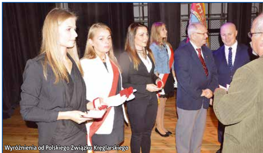
Wyróżnienia od Polskiego Związku Kręglarskiego