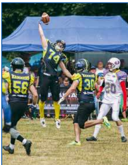
Ored. Hammersi szukają zawodników

Łaziska drużyna futbolu amerykańskiego poszukuje nowych zawodników. Rekrutacja do zespołu odbędzie się 28 października na stadionie Polonii przy ul. Staszica 31b w Łaziskach Średnich. Wymagania – ukończone 17 lat, chęć spróbowania swoich sił w futbolu. Konieczny do wzięcia udziału w rekrutacji – strój sportowy. Członkowie drużyny zapraszają wszystkich chętnych na stadion od godz. 17.00 – jak sami mówią – Uwaga! Ten sport uzależnia!