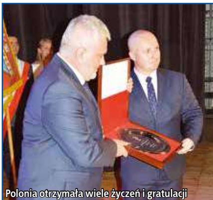
Polonia otrzymała wiele życzeń i gratulacji