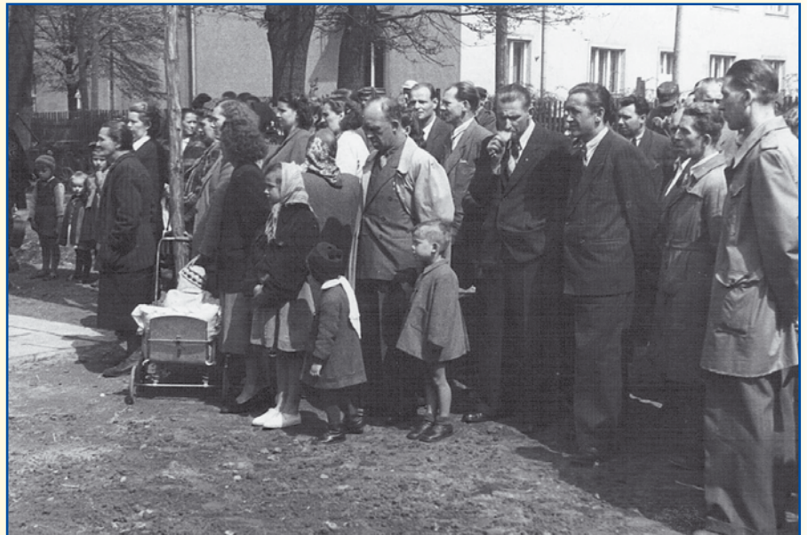
Uroczystość zgromadziła wielu mieszkańców