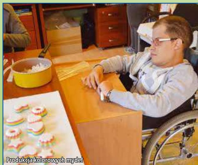
Produkcja kolorowych mydeł