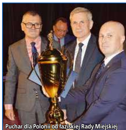
Puchar dla Polonii od łaziskiej Rady Miejskiej

W imieniu zarządu KS Polonia Łaziska Górne pragnę złożyć wszystkim gorące podziękowania za udział w obchodach jubileuszu 90-lecia klubu. To zaszczytny jubileusz i szczególna uroczystość, na którą swoją postawą i zaangażowaniem pracowało wiele pokoleń naszych zawodników oraz wspaniałych ludzi wspierających dotychczasowe działania. Wyrażam wdzięczność za przybycie dostojnym gościom, byłym i obecnym działaczom, trenerom, zawodnikom, sympatykom oraz sponsorom, którzy swoją obecnością uświetnili uroczystości oraz podkreślili jedność z wartościami stanowiącymi tożsamość naszego klubu.