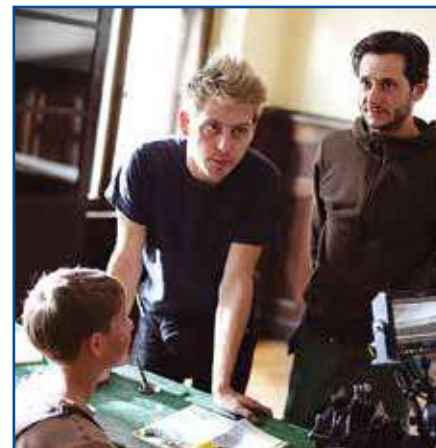
Reżyser podczas pracy

Która z nagród jest dla Pana szczególnie ważna?