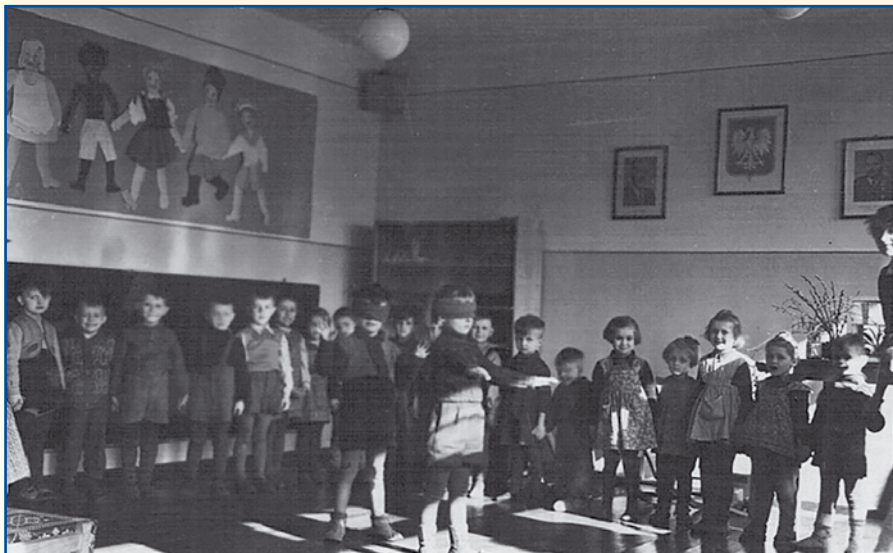
Dzieci przedszkolne podczas zabawy w ciuciubabkę – rok 1952