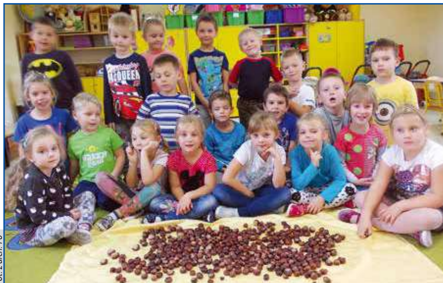
Dzieci z „szóstki” włączyły się do akcji zbierania kasztanów i żołędzi dla leśnych zwierząt