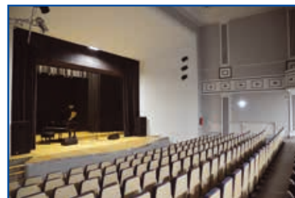
... i efekt końcowy