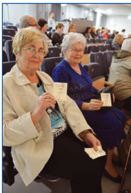
Seniorzy bardzo chętnie uczestniczą we wszystkich zajęciach

W tym roku Uniwersytet Trzeciego Wieku ma ponad 180 słuchaczy