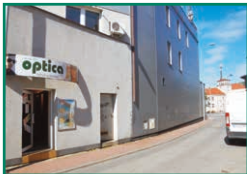
Jeden z naszych salonów w Łaziskach Górnych przy ul. Barlickiego 1 (wejście również od ul. Wąskiej)