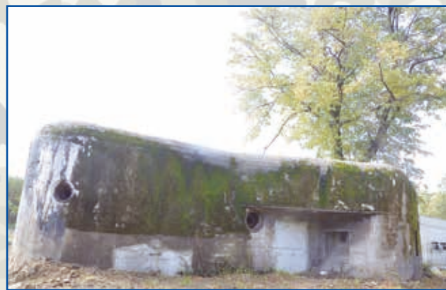
Bunkier przy ul. Polnej, na prywatnej posesji

Łaziskie bunkry są dobrze zachowane i z pewnością mogłyby stanowić atrakcję turystyczną. Stowarzyszenie Pro Fortalicium zajmuje się między innymi remontem, wyposażaniem w rekwizyty