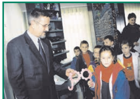
Wizyta w naszym salonie wychowanków z Przedszkola nr 7 - 2002 rok