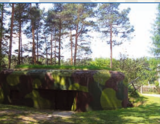
Wyremontowany bunkier Sowiniec w Gostyni