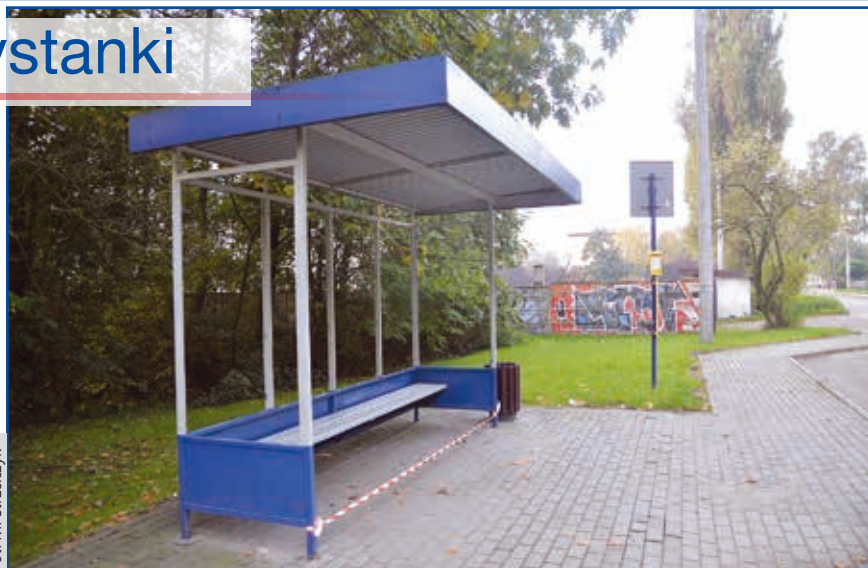
W ramach prac konserwacyjnych wiaty przystankowe były czyszczone i malowane