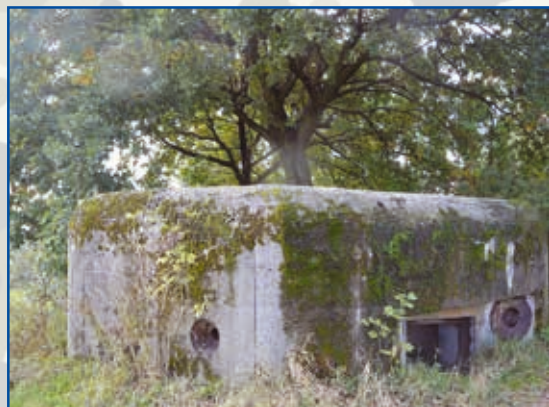
Bunkier na Wierzyisku, w okolicy kamieniołomu

N a terenie Łazisk mamy sześć bunkrów, a właściwie schronów bojowych, bo takie jest fachowe polskie określenie tego typu budowli. Natomiast często używany wyraz bunkier przyjął się u nas z języka niemieckiego, a swoją genezę ma w języku angielskim. Łaziskie schrony to część fortyfikacji Obszaru Warownego Śląsk, który ciągnie się na długości około 60 kilometrów od miejscowości Przeczyce w powiecie będzińskim do Gostyni. Pierwsze przygotowania do obrony terenów przemysłowych okręgu śląsko-dąbrowskiego rozpoczęto już w latach 20. XX wieku, ale budowa fortyfikacji przypada na lata 1933–38. Plany dotyczące śląskich umocnień nie obejmowały jeszcze wtedy obszaru Mikołowa. Przedłużenie tej linii aż do rzeki Gostynki związane było z koncentracją wojsk niemieckich w rejonie Gliwic, Wilczego Gardła i Bojkowa, a momentem