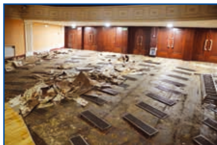
Poszczególne etapy remontu...