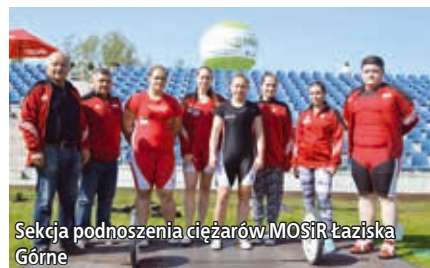
Sekcja podnoszenia ciężarów MOSiR Łaziska Górne