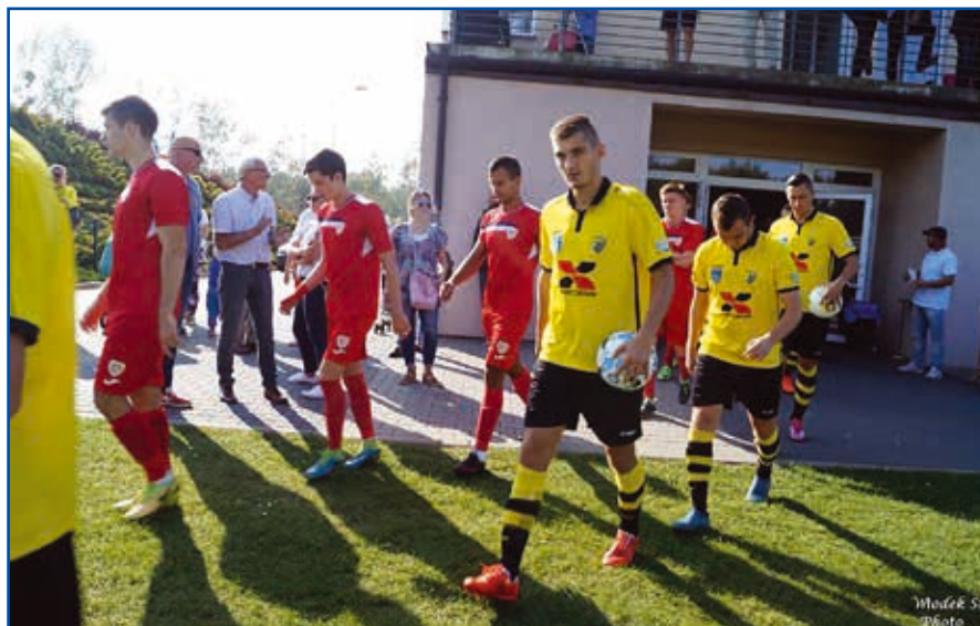
O godzinie 16.00 na murawę stadionu miejskiego wyszli zawodnicy Polonii i Piasta Gliwice