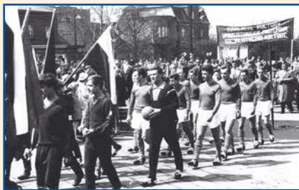
Zawodnicy Górnika Łaziska Średnie w czasie pochodu pierwszomajowego 1964 roku

W latach 50. i 60. wielu łaziszczan wyczynowo uprawiało kilka dyscyplin