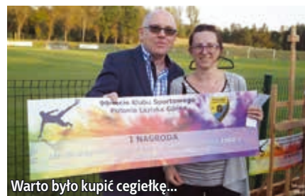
Warto było kupić cegiełkę...