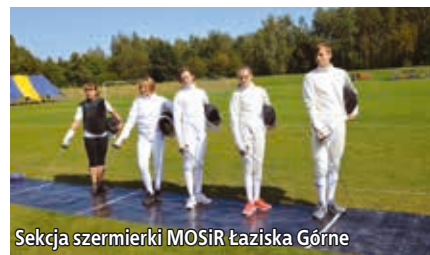
Sekcja szermierki MOSiR Łaziska Górne