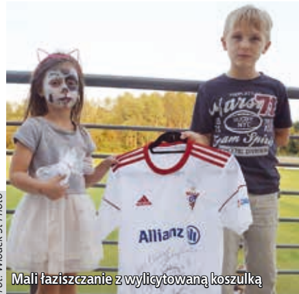
Mali łaziszczanie z wylicytowaną koszulką