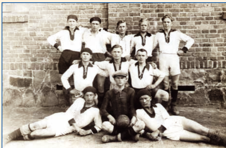
Drużyna piłkarska SMP z Łazisk Średnich, lata 30.