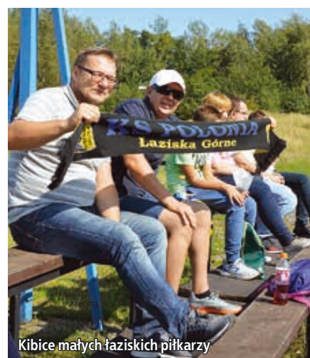
Kibice małych łaziskich piłkarzy