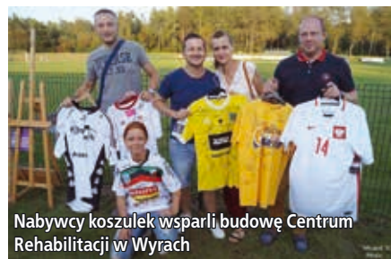
Nabywcy koszulek wsparli budowę Centrum Rehabilitacji w Wyrach