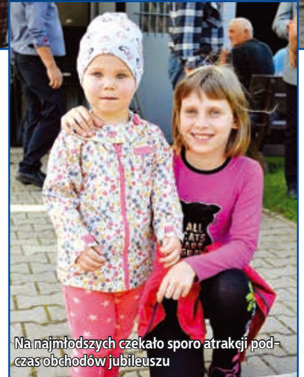
Na najmłodszych czekało sporo atrakcji podczas obchodów jubileuszu