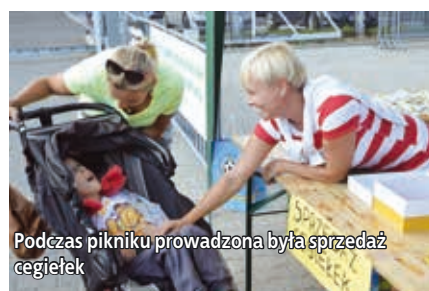
Podczas pikniku prowadzona była sprzedaż cegiełek