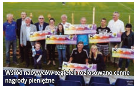
Wśród nabywców cegiełek rozlosowano cenne nagrody pieniężne