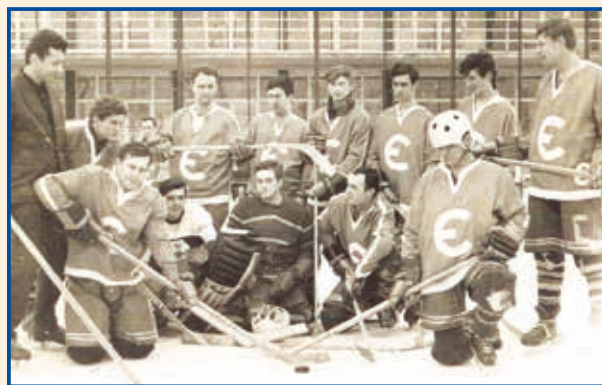
Drużyna hokejowa Elektro Łaziska Górne