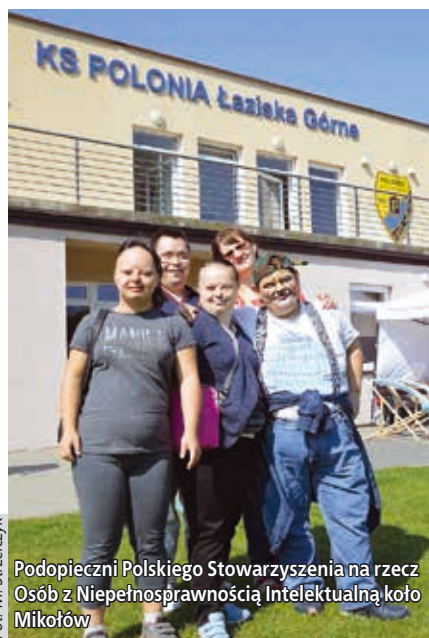
Podopieczni Polskiego Stowarzyszenia na rzecz Osób z Niepełnosprawnością Intelektualną koło Mikołów