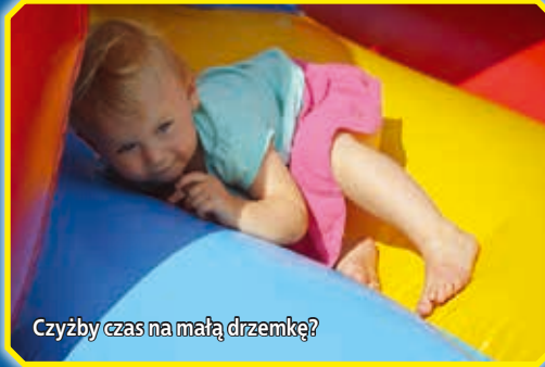
Czyżby czas na małą drzemkę?