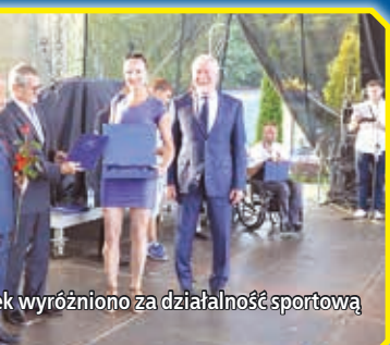
Wyróżniono za działalność sportową