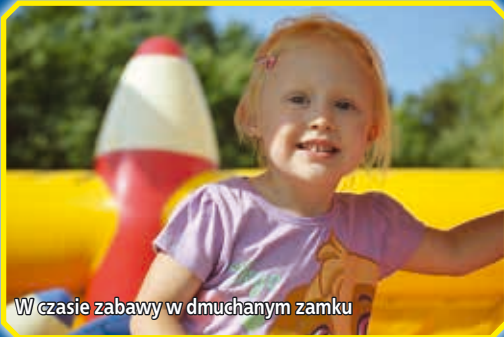
W czasie zabawy w dmuchanym zamku