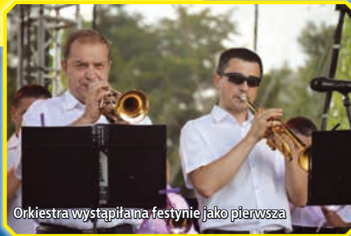
Orkiestra wystąpiła na festynie jako pierwsza