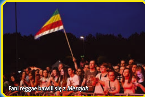
Fani reggae bawili się z Mesajah