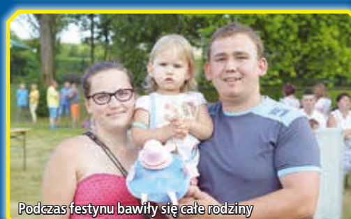
Podczas festynu bawiły się całe rodziny