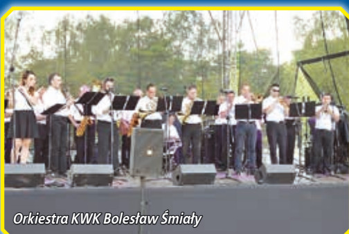
Orkiestra KWK Bolesław Śmiały