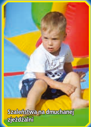
Szaleństwa na dmuchanej zjeżdżalni