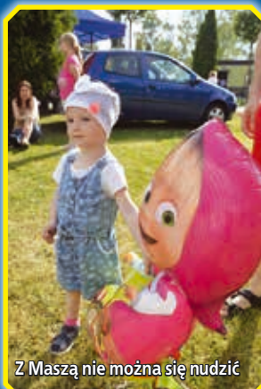
Z Maszą nie można się nudzić