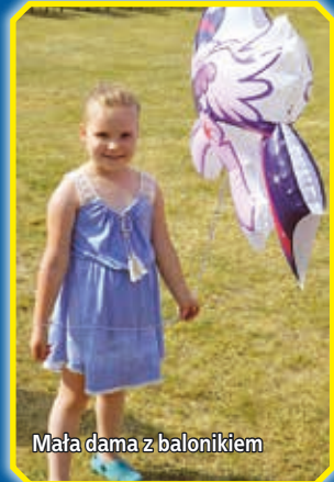
Mała dama z balonikiem