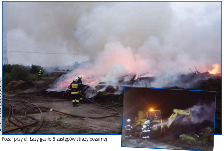
Pożar przy ul. Łazy gasiło 8 zastępów straży pożarnej

Nie wiadomo, jaka była przyczyna pożaru, ale z informacji przekazywanych przez strażaków wynika, że mogło dojść do podpalenia. Dzięki temu, że ogień został wcześniej zauważony przez pracownika PGKiM, udało się szybko ugasić płonące drzewa. Do akcji zaangażowano również ciężki sprzęt – koparka odgarniała nadpalone odpady, a strażacy dogaszali zgliszcza. Przystąpiliśmy do porządkowania terenu. Około 700 m 3 gałęzi razem z pozostałościami z pożaru wywozimy do kompostowni w Rybniku. Są to niestety dodatkowe koszty dla spółki – informuje Iwona Ranoszek , zastępcza prezesa PGKiM. Oms