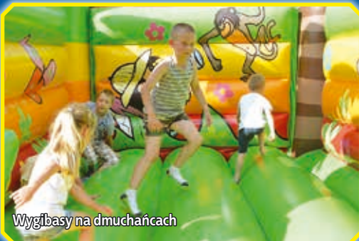
Wygibasy na dmuchańcach