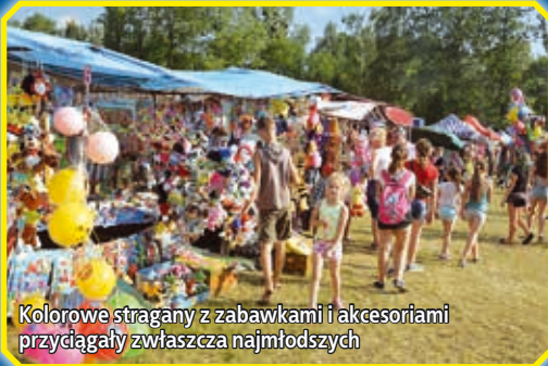
Kolorowe stragany z zabawkami i akcesoriami przyciągały zwłaszcza najmłodszych