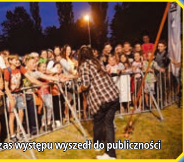
W czasie występu wyszedł do publiczności