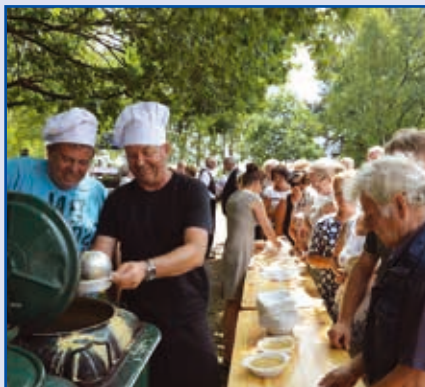
Po mszy na wszystkich czekała pyszna grochówka