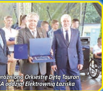
Wyróżniono Orkiestrę Dętą Tauron i oddział Elektrowni Łaziska