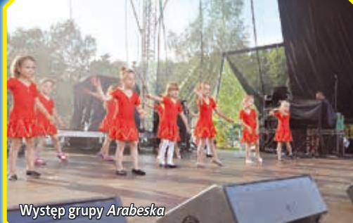
Występ grupy Arabeska