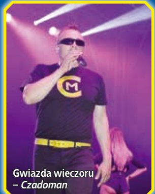
Gwiazda wieczoru – Czadoman