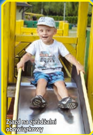
Zjazd na zjeżdżalni obowiązkowy