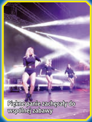
Piękne panie zachęcały do wspólnej zabawy