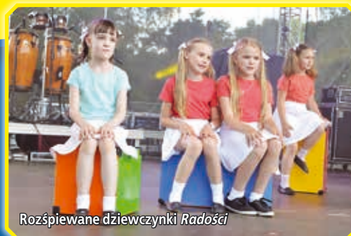
Rozśpiewane dziewczynki Radości