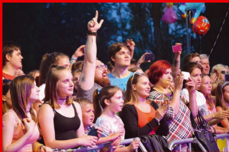
Fot. M. Strzelczyk, K. Wiśniewska