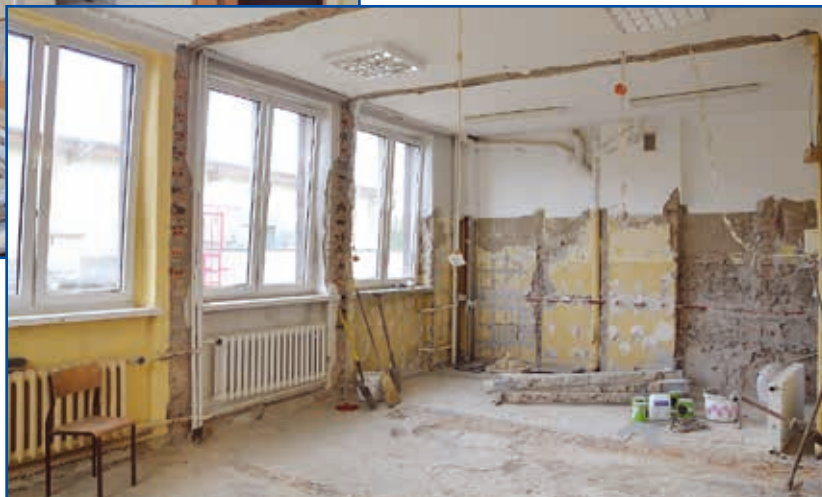
W „piątce” powstaje dodatkowa sala lekcyjna

również Gimnazjum nr 1, które od września będzie Szkołą Podstawową nr 3. Oprócz przygotowania i odpowiedniego wyposażenia sali lekcyjnej, jest również przebudowywana świetlica, gdzie wydzielone będzie osobne pomieszczenie dla najmłodszych uczniów podstawówki. Ko-