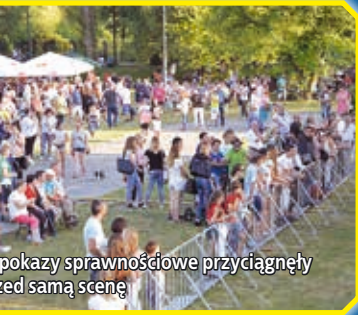
Wspokazy sprawnościowe przyciągnęły przed samą scenę