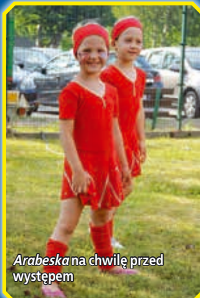
Arabeska na chwilę przed występem