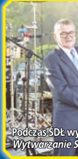
Podczas ŚDŁ wy Wytwarzanie S