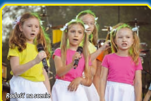
Radość na scenie