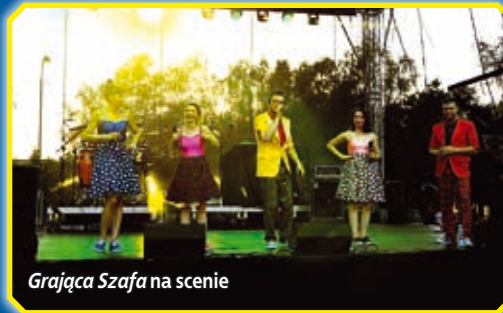
Grająca Szafa na scenie