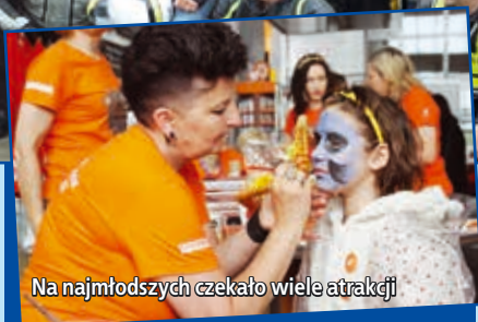
Na najmłodszych czekało wiele atrakcji