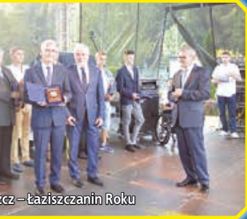
Wyróżniono Łaziszczanin Roku