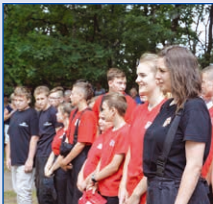
Młodzi kandydaci na strażaków podczas eucharystii

Msze św. na Wierzysku odprawiane są od 1989 roku – zawsze 24 czerwca w dniu wspomnienia patrona miasta św. Jana – i są stałym punktem obchodów Świętojańskich Dni Łazisk. W tym roku uroczysta eucharystia w intencji mieszkańców odprawiona została w sobotę o godz. 11.00. Brała w niej udział społeczność Łazisk Górnych, Średnich, Dolnych, sąsiedzi zza miedzy – wyrzanie, przedstawiciele władz miejskich, łazickich zakładów pracy, strażacy i harcerze. O oprawę muzyczną zadbały połączone łazickie chóry. Po mszy na wszystkich czekała pyszna grochówka oraz koncert Orkiestry Dętej KWK Bolesław Śmiały . Oms