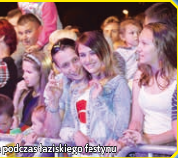
podczas łaziskiego festynu