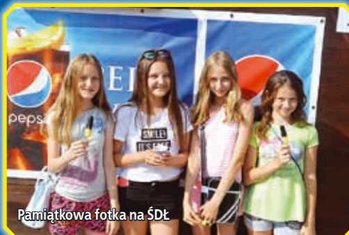
Pamiętkowa fotka na ŚDŁ