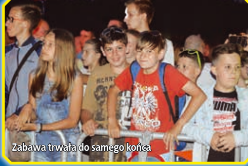
Zabawa trwała do samego końca