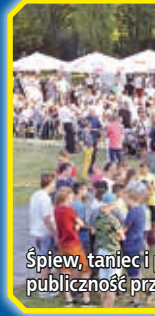
Śpiew, taniec i publiczność prz