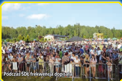
Podczas ŚDŁ frekwencja dopisała