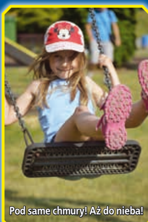
Pod same chmury! Aż do nieba!