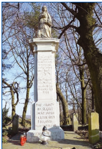
Od 1947 roku na cokole pomnika na Wierzysku stoi nowa figura św. Jana Ewangelisty