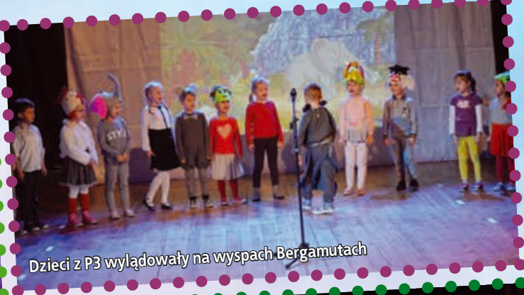
Dzieci z P3 wylądowały na wyspach Bergamutach