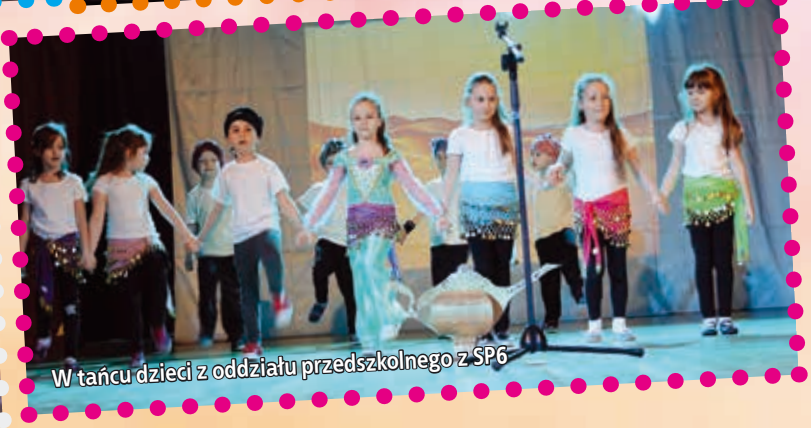
W tańcu dzieci z oddziału przedszkolnego z SP6