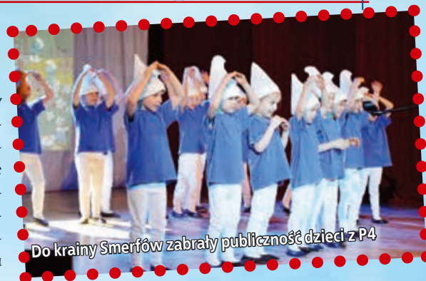
Do krainy Smerfów zabraly publiczność dzieci z P4