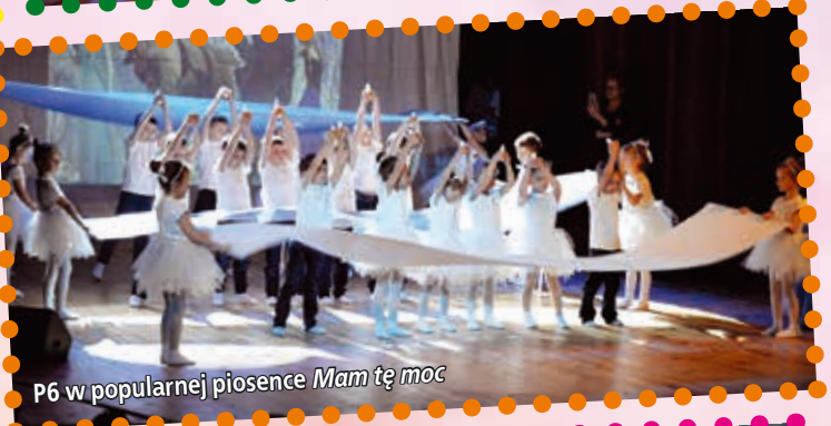
P6 w popularnej piosence Mam tę moc