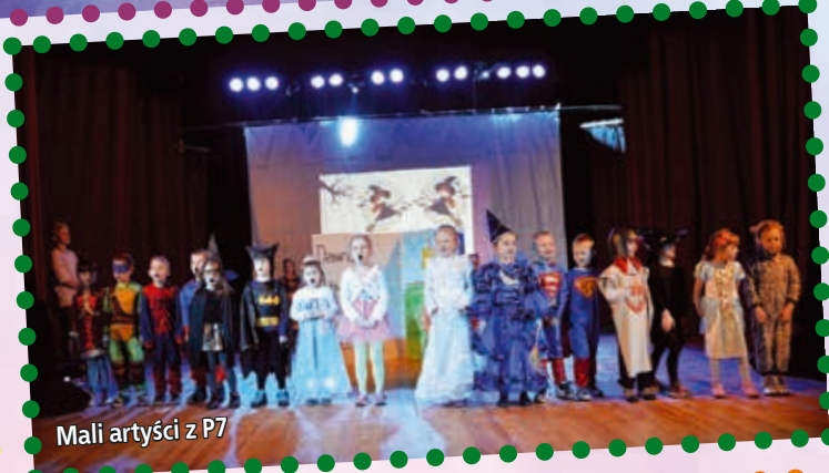
Mali artyści z P7