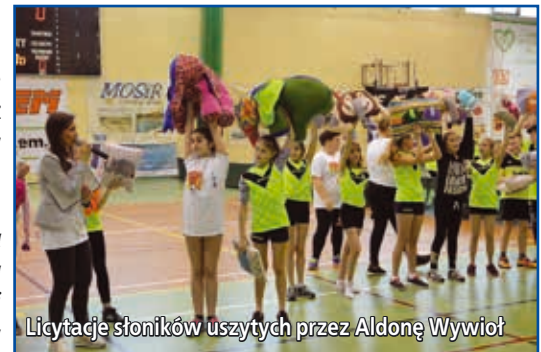
Licytacje słoników uszytych przez Aldonę Wywiół