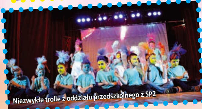
Niezwykłe trolle z oddziału przedszkolnego z SP2