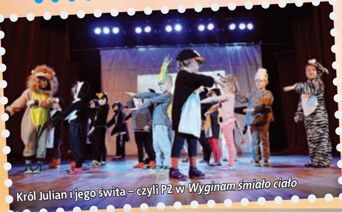
Król Julian i jego świta – czyli P2 w Wyginam śmiało ciało