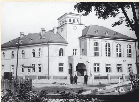
Urząd Gminy i Posterunek Policji Państwowej w Łaziskach Górnych w 1929 r.