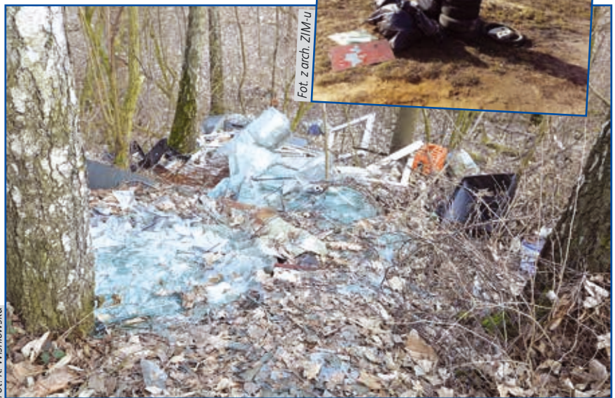
Dzikie wysypiska w lesie za Ogródkami Działkowymi Hutnik oraz śmieci pozostawione przy ul. Poręba (małe zdjęcie)