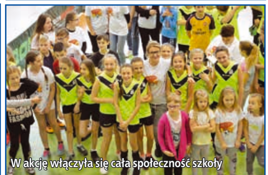
W akcję włączyła się cała społeczność szkoły