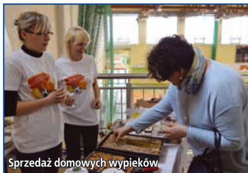
Sprzedż domowych wypieków