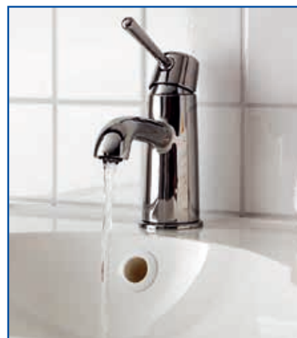
Dostawy wody będą wstrzymywane od godz. 24.00 do 6.00

Od czerwca czekają nas ograniczenia w dostawie wody. Jak wynika z wytycznych Wojewódzkiego Funduszu Ochrony Środowiska i Gospodarki Wodnej, wstrzymanie dostaw wody będzie dotyczyło godzin nocnych – od godz. 24.00 do 6.00