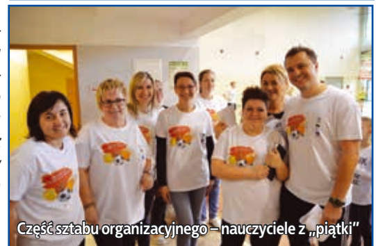
Część sztabu organizacyjnego – nauczyciele z „piątki”