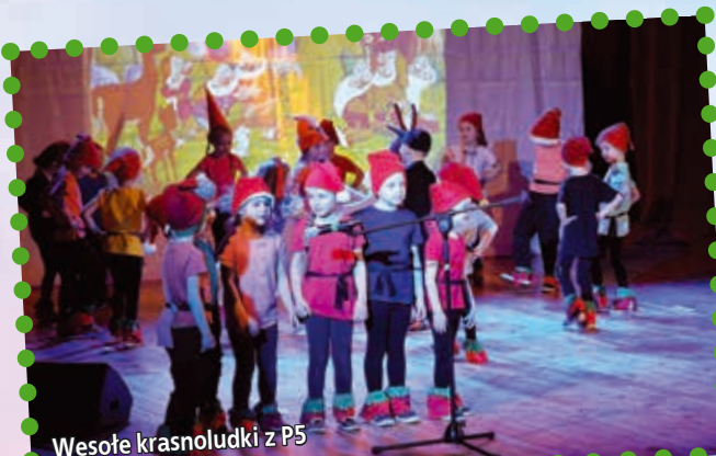
Wesołe krasnoludki z P5