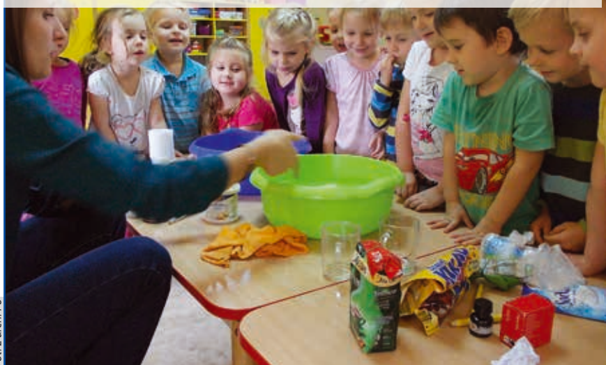
Biedronki z P6 uwielbiają eksperymentować

W grupie Biedronek wiele się dzieje na co dzień! Dzieci eksperymentują, badają, obserwują, odkrywają, a przede wszystkim – dobrze się bawią. Zetknęły się m.in. z produkcją mydła, poznały zjawisko jego rozpuszczalności w zależności od temperatury. Biedronki własnoręcznie wykonywały też własne mydełka. Woda i jej właściwości również zostały wzięte pod lupę: sprawdzaliśmy, co może się w niej rozpuścić (zarówno w zimnej, jak i ciepłej) i byliśmy ciekawi zatapialności różnych przedmiotów. Biedronki wspólnie wykonywały lampę lawę, kolorowe wodne wulkany, galaktykę w słoiku, jak i wiele innych eksperymentów związanych z wodą. To tylko część z tego, czego dowiadujemy się właśnie na naszych zajęciach.