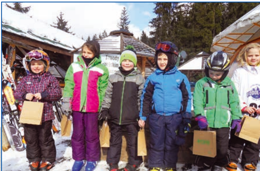
Najmłodszy uczestnicy tegorocznych Zawodów o Puchar Burmistrza Miasta