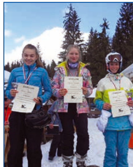
Zwycięzcy w kategorii 10-16 lat