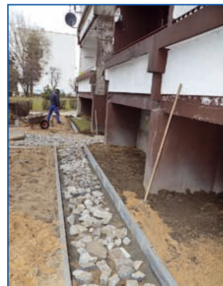
Remont chodników na os. Kościuszki