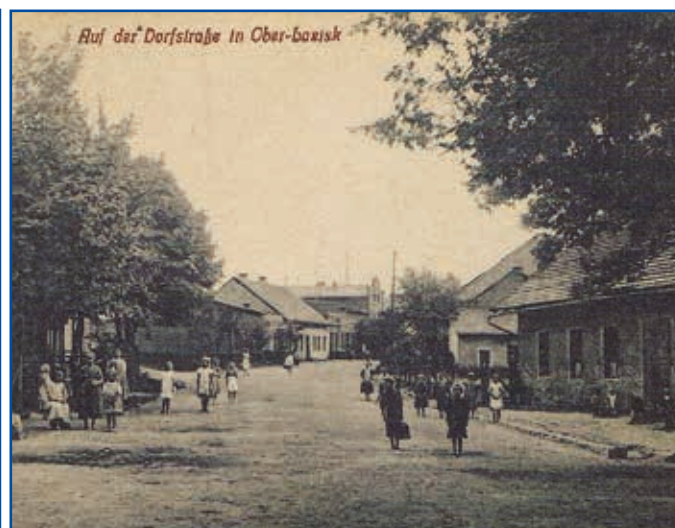
Ulica Wiejska – obecnie Barlickiego