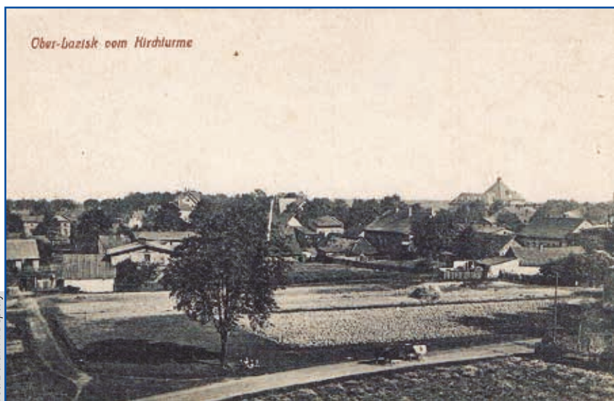
Widok z wieży kościelnej w stronę centrum Łazisk Górnych

Zachęcamy wszystkich mieszkańców do przejrzenia swoich starych albumów i pozienienia się z nami swoimi unikatowymi zbiorami. Oms