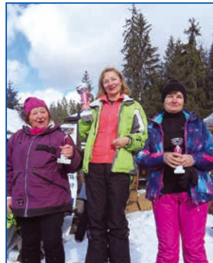
X edycję zawodów można zaliczyć do udanych